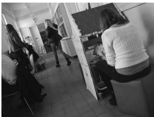
Slika 3: Dijakinja pri izbiranju knjig