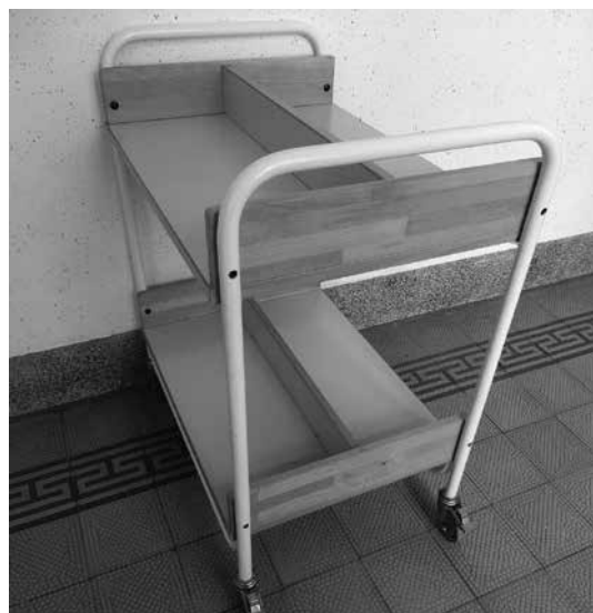
Slika 1: Voziček za knjige

Iz vozička za knjige lahko nastane praznična hiška knjig: za izdelavo sem uporabila kartone, barvice in malo iznajdljivosti. Stranici hiške sta narejeni iz odpadnih škatel, povezuje pa ju streha, izdelana iz rdečega fotokartona. Pri ustvarjanju je sodelovala tudi dijakinja, ki je spretno porisala in okrasila sprednjo stran hiške z božično-novoletnimi elementi.