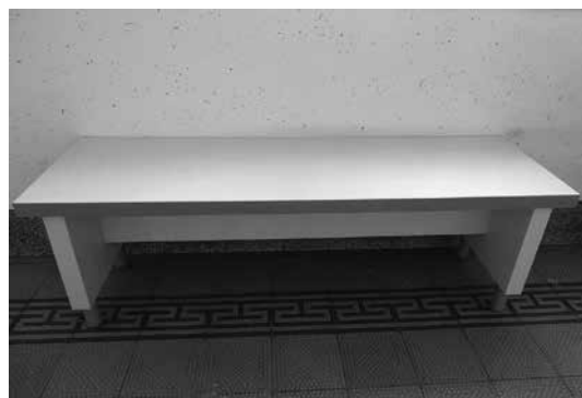
Slika 4: Klop