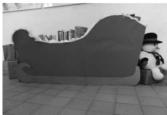
Slika 5: Božičkove sani