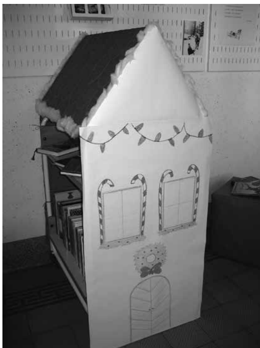
Slika 2: Praznična hiška knjig