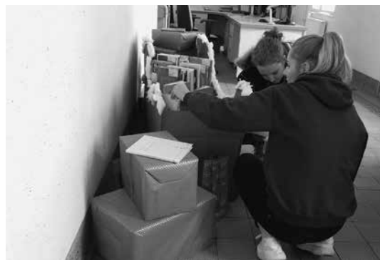
Slika 6: Dijakinji pri izbiranju knjig