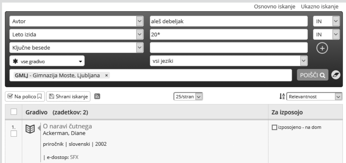
Slika 2: S pomočjo izbirnega iskanja so iskali natančneje in bolj pregledno.