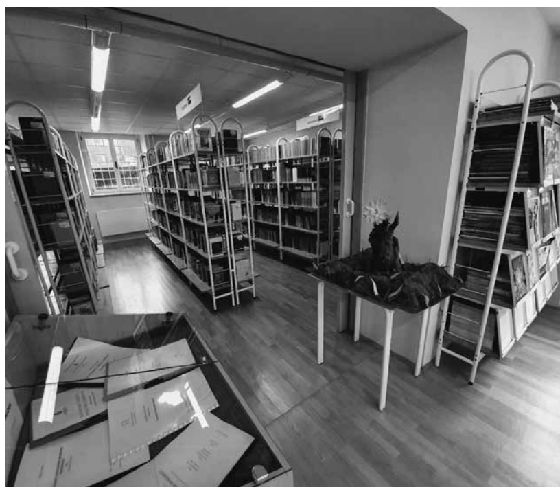
Slika 1: Pogled v gimnazijsko knjižnico

Ohranjamo uvodno uro v knjižnici za dijake 1. letnika, ko se ob začetku šolanja spoznajo z njo ter izvedbo knjižničnih informacijskih znanj, kjer se dijaki naučijo citirati in navajati vire.