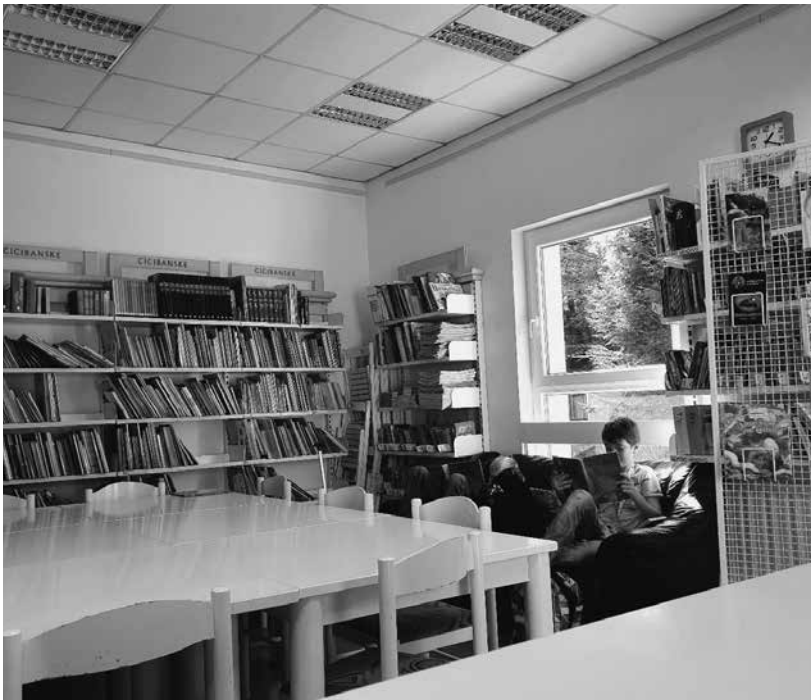
Slika 3: Knjižnica na osnovni šoli

Na osnovni šoli me v knjižnici razveseljujejo mlade nadobudne glavice, ki komaj kukajo čez pult in pridejo vsaj enkrat tedensko po dve novi knjigi, srednjeolci pa pogosto pridejo namesto v svetovalno službo na pogovor kar v knjižnico.