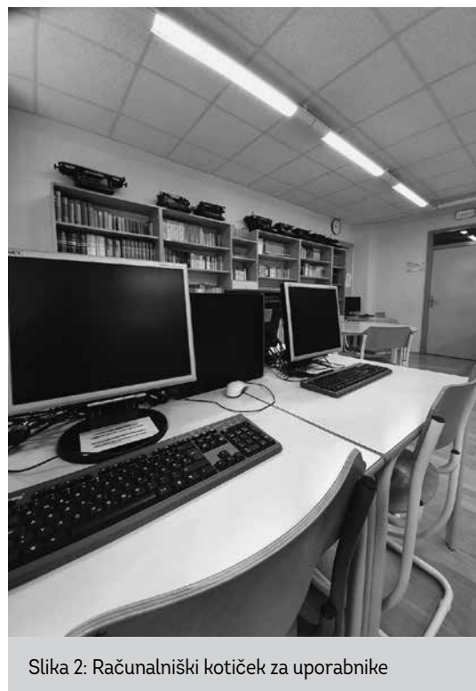
Slika 2: Računalniški koticček za uporabnike

Čitalniških mest v knjižnici osnovne šole imamo manj kot v srednji šoli, pa vendar so večinoma vsak dan zasedena – učenci pridejo v knjižnico in delajo naloge, včasih se igrajo družabne igre.