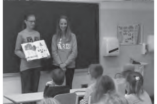
Sliki 2 in 3: Radi poslušamo pravljice in navdušeno rešujemo knjižne uganke. (Damjana Nanut)