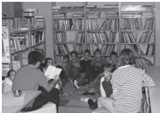
Slika 4: Devetošolci pa res znajo brati. (Zorka Paulina)

Razredne učiteljice so vsako jutro učencem brale izbrano knjigo. Ob branju so najmlajši