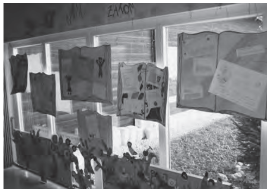
Slika 7: Plakati na šolskem hodniku (Slavica Della Bianca)

Na bovški šoli so mnenja o prebranih knjigah zapisovali in ilustrirali učenci ter jih predstavili na izvirnih plakatih v hodniku pred šolsko knjižnico.