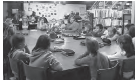
Slika 5: Po poslušanju radi poustvarjamo.