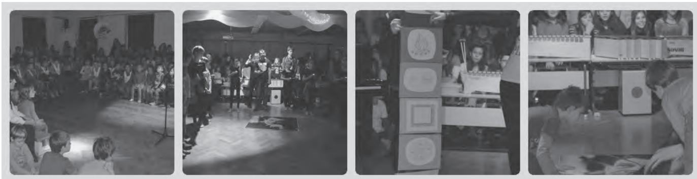
Slika 6: Proslava ob dnevu samostojnosti in enotnosti

boj, da ima vodstvo posluh za dodatne aktivnosti in akcije, ki obogatijo pouk ter utrdijo medvrstniško sodelovanje. Upoštevajoč vtise učencev, ki so bili ob koncu vsake dejavnosti več kot pozitivni in nad pričakovanji, lahko zapišem, da so se z vsako dejavnostjo naučili kaj novega. Ob posameznih evalvacijah (izvedene so v okviru posameznih aktivov) ugotavljamo, da sta zelo pomembna podajanje izkušenj in