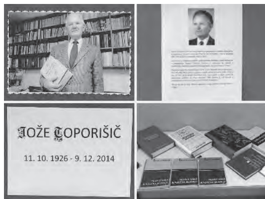
Slika 5: Razstava Jože Toporišič

Decembra 2014 je preminil slovenski jezikoslovec Jože Toporišič, zato so učenci na