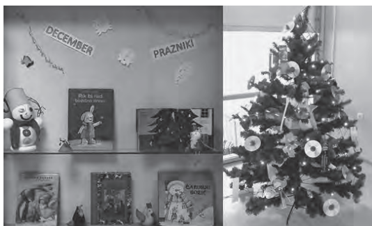
Slika 1: Praznična vitrina in okrašena smreka

Veliko vlogo pri urejanju in pripravi knjižnice so imeli udeleženci obeh knjižničarskih krožkov, ki so v okviru krožka izdelovali novoletne okraske in darila, s katerimi so polepšali knjižnico. Zimske pravljice ter literarni junaki so krasili vitrine pred knjižnico in napovedovali mesec prazničnih pravljic, sladkih dobrot in dobrih mož. V knjižnici so učenci okrasili jelko z lastnoročno izdelanimi visečimi knjižnimi kazali, dodali so igrače ter pisane zgoščenke. Navdušeni nad svojo unikatno okrašeno jelko in drugim okrasjem so v knjižnico na ogled povabili svoje sošolce in sorodnike.