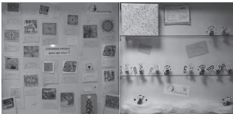
Slika 4: Razstava projekta eTwinning - izbrane voščilnice ter darila iz tujine

Vsakič ob iztekanju leta se strokovni delavci na šoli povezujemo in v sodelovanju z učenci ter starši izpeljemo veliko dejavnosti. V prispevku je bilo opisanih le nekaj dejavnosti, ki jih izvajamo vsako šolsko leto. Ob tem je resnično pomembno, da mentorji sodelujemo med se-