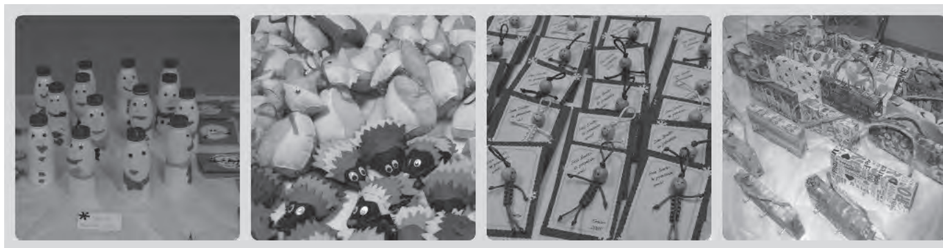
Slika 2: Ponudba izdelkov na sejmu

Tudi pouk KIZ v knjižnici je bil praznično obarvan. Nekaj razredov se je udeležilo novoletnega interaktivnega kviza ali ogleda pra-