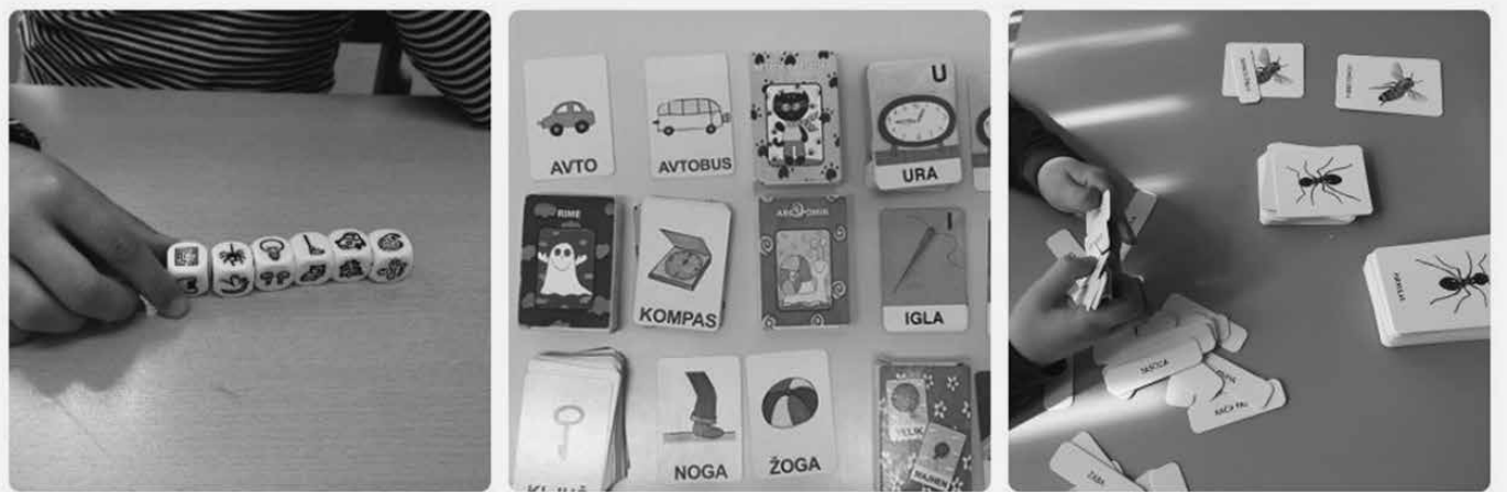
Slike 1–3: Prva slika prikazuje učenko, ki je s pomočjo kock pripovedovala zgodbo. Na drugi sliki so karte, s pomočjo katerih učenci vadijo rime, sopomenke ter sestavljajo stavke. Na zadnji sliki pa so posebne kartice, s pomočjo katerih učenci prepoznavajo slike, jih poimenujejo, se učijo branja in izgovorjave.

Na podlagi odločbe se lahko dodatna strokovna pomoč izvaja kot pomoč za premagovanje primanjkljajev in ovir oziroma motenj ali kot oblika učne pomoči, ki jo izvaja učitelj.