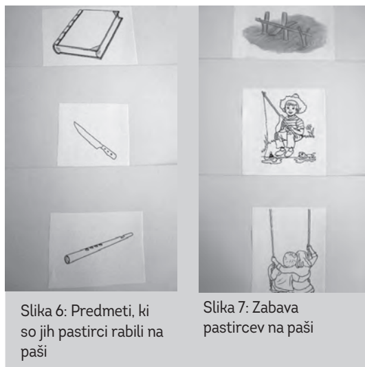
Slika 6: Predmeti, ki so jih pastirci rabili na paši