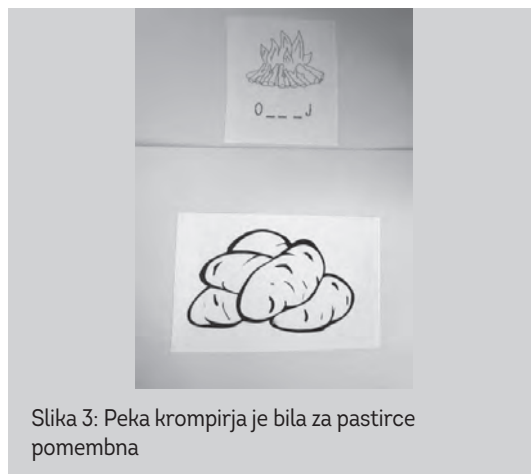
Slika 3: Peka krompirja je bila za pastirce pomembna

Na kratko sem jim predstavila življenje in delo pisatelja. Sledilo je poslušanje izbranega odlomka. Vsebino smo obnovili s pomočjo slikovnega gradiva (slike 3–7).