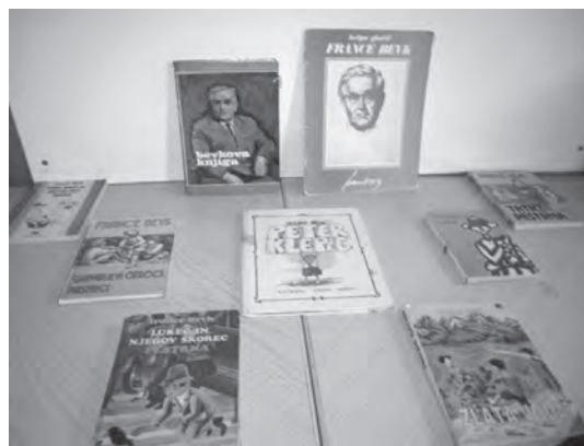
Slika 2: Razstavljen dela Franceta Bevka v šolski knjižnici

Ob prihodu v šolsko knjižnico so si učenci ogledali razstavljen dela pisatelja Franceta Bevka (slika 2).