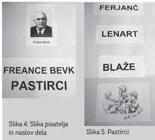
Slika 4: Slika pisatelja in naslov dela

Vodeno branje se dopolnjuje s pogovorom o prebranem in večkratni bolj ali manj (odvisno od učenca in njegovih primanjkljajev) natančni obnovi prebranega. ●