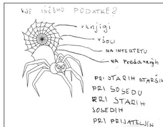
Slika 4: Delovni list z vprašanjem Kje iščemo podatke?

Vsi učenci, tudi učenci s posebnimi potrebami, ki obiskujejo OŠ PP NIS, so lahko uspešni. Pri tej uri so bili. Dokaz za to je tudi opravljena domača naloga, kjer so vsak zase glede na svoje sposobnosti in zmožnosti izpolnili delovni list (Slika 4).