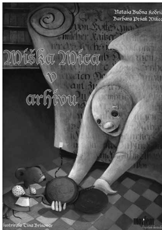
Slika 1: Naslovnica knjige Miška Mica v arhivu

Tako sem jim poskušala približati svet branja in jim odprla svetove, ki jih sicer ne bi spoznali. Namreč, ko beremo ali pa vsaj natančno, zbrano poslušamo, se učimo novih besed, knjižnega jezika, bogatimo besedišče in pridobivamo znanje o okolju. Kot šolska knjižničarka se zavedam, da z branjem raznolike literature tudi v učencih s posebnimi potrebami spodbujam pozitiven odnos do branja, knjig, jezika; hkrati pa jih s skupnim branjem usmerjam k vseživljenjskemu razvoju, učenju (povzeto po Pomen branja otrokom).