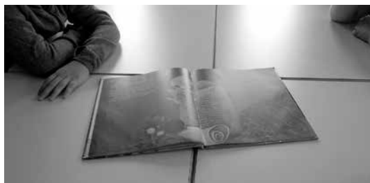
Slika 2: Obnova zgodbe s pomočjo ilustracij iz knjige

ljivo obnovili (Slika 2). Ob tem smo ponovili ali razložili posamezne pojme, kot so: zgodovinski viri in vrste virov, kje hranimo vire in kaj je arhiv, kronika, kaj je listina ipd.