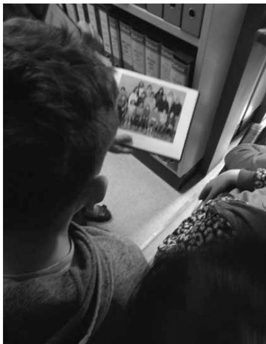
Slika 3: Obisk šolskega arhiva

Ker si učenci, ki obiskujejo OŠ PP NIS, teže zapomnijo stvari, ki so bolj abstraktne, sem se domislila presenečenja. Odpeljala sem jih do poslovne sekretarke šole, ki skrbi za šolski arhiv. Na veliko presenečenje učencev nas je vse skupaj odpeljala v šolski arhiv, ki so ga prvič videli in obiskali (slika 3). Občudovali so zatemnjen prostor, ki je bil napolnjen s posebnim vonjem po starem papirju in na policah do stropa založen s posebnimi arhivskimi škatlami. V prostoru so opazili tudi gasilni aparat in šibkejšo svetlobo, ki ni dobro osvetljevala prostora. Ugotovili so tudi, da je prostor neogrevan in okno zatemnjeno.