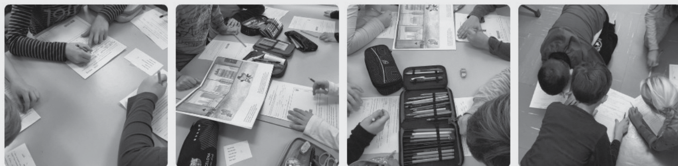
Slika 3: Fotografije prikazujejo, kako so učenci skupinsko reševali učne liste, si pomagali ter sodelovali.

4. Pri rdeči črki L poišči knjigo z naslovom Juš in gospod Mišon . Pravilno dopolni začetek besedila zgodbe ter odgovori na vprašanja in prepiši nalepko.