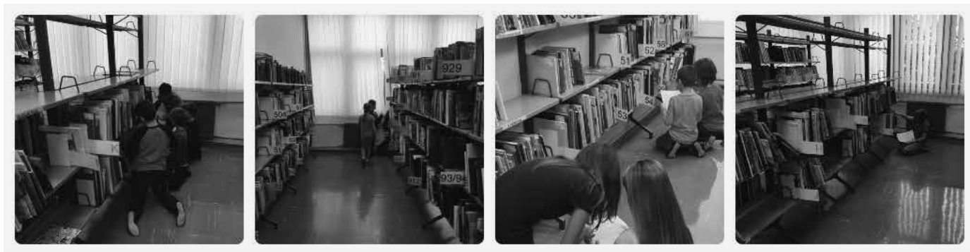
Slika 2: Fotografije prikazujejo, kako so skupine sistematično raziskovale gradivo na policah.