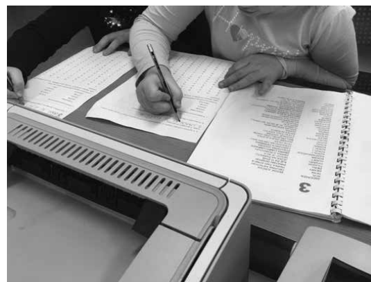
Slika 1: Učenke po seznamu za bralno značko iščejo gradivo, nato jih poiščejo na ustrezni polici.

Pomembno je tudi, da so si v treh letih šolanja zapomnili urejenost seznama za bralno značko. Seznam je natisnjen v barvah, saj tako povežejo barvo, s katero je natisnjen priimek avtorja, z barvami črk na policah. Primer: police za prvo triletje z oznako C imajo nalepljene rdeče črke, zato so imena avtorjev del, ki jih najdemo na teh policah, na seznamu natisnjeni z rdečo barvo. Tako gre učenec lahko takoj preveriti, denimo, priimek Andersen (natisnjen z rdečo barvo) na polico z rdečo črko A. S tem je olajšano iskanje gradiv, še posebno kadar je v knjižnici gneča, pa tudi zato ker je v knjižnici zaposlen le en knjižničar, ki ne more pomagati hkrati iskati gradiva vsem učencem. Tako postanejo učenci samostojnejši uporabniki knjižnice.