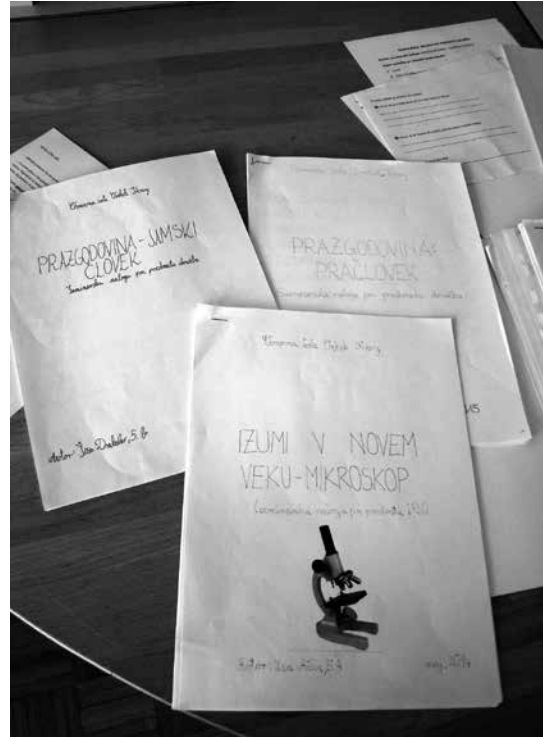
Slika 2: Primeri že izdelanih pisnih nalog

Po izvedeni uvodni aktivnosti so s knjižničarko ponovili koncept izdelave pisne naloge (deli naloge, naslovna stran, navajanje virov in literature) in si ogledali »plonk listek« oziroma pomoč na spletni strani šole, kjer je v zavihku šolske knjižnice objavljen primer dobre pisne