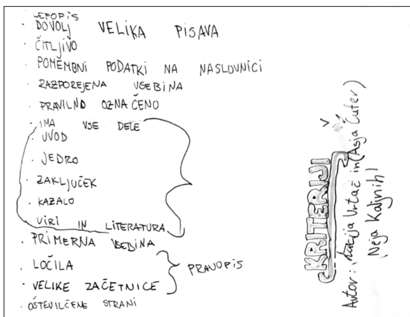
Slika 4: Oblikovani kriteriji za dobro pisno nalogo

Ko so končali, je vsaka skupina kriterije predstavila preostalim skupinam. Kriterije so zapisali na tablo, združili po vsebini in pomenili za vse. Nastali kriteriji bodo temelj za nadaljnje delo po izdelavi pisnih nalog. Učenci so v zvezek naredili še zapis kriterijev. Te bodo uporabili pri sovrstniškem vrednotenju pisnih nalog svojih sošolcev oziroma sošolk.