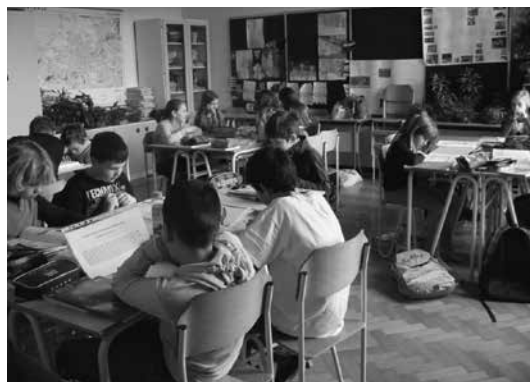
Slika 1: Delo po skupinah

Delo v razredu je potekalo v štirih skupinah po naslednjih učnih korakih.