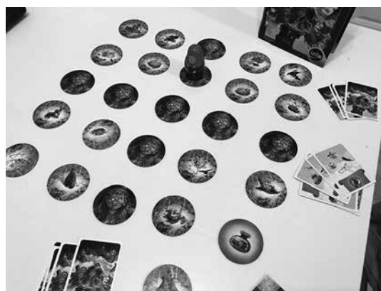
Slika 1: Postavitev za igranje igre baba yaga ter reševanje urokov

Učence sem povabil v knjižnico, ko že imajo predznanje, saj so se pri pouku slovenščine že srečali z ljudsko pravljico, natančneje slovensko ljudsko pravljico, značilnostmi, motivi, strukturo in tipičnimi pravljicnimi osebami. Za uvodno motivacijo sem omenil družabno igro, ki je nastala po predlogi ljudske pravljice, ki jo bodo v nadaljevanju tudi spoznali. Pokazal sem igro baba yaga ter povabil učence k igranju v jutranjem in popoldanskem času (igra je namenjena od 2 do 5 igralcem 1 ).