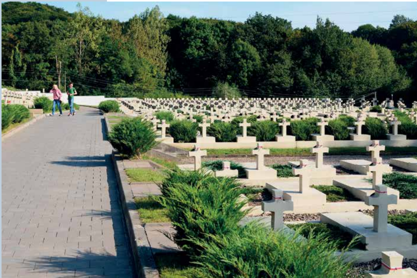
Poljsko pokopališče pri Lvivu v Ukrajini.