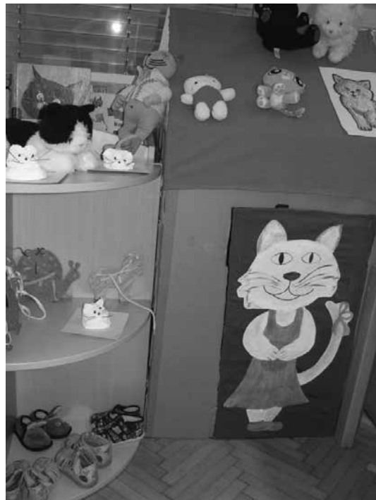
Slika 3: Po zgodbi Muca copatarica smo izdelali mačjo hišo in muce iz slanega testa.

jem in zanimanjem poslušajo. V knjižnici je v ta namen pripravljena pravljica soba, ki je po navadi tudi motivacijsko opremljena. Po navadi imamo po pravljicni uri še delavnico, ki se nanaša na pripovedovano zgodbo ali pravljico.