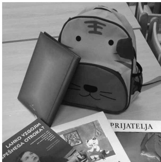
Slika 4: Knjižni nahrbtnik

Vzgojiteljica priskrbi ustrezno literaturo za branje, glede na starostno stopnjo otrok v skupini (drugo starostno obdobje). Pripravi nahrbtnik, v katerega da tri knjige: dve knjigi za otroke in literaturo za starše. Zraven priloži zvezek, v katerem so spremna beseda in navodila za izvedbo naloge. Vsak teden en otrok nahrbtnik odnese domov. Starši mu doma preberejo knjige, otrokovo pripovedovanje pa zapišejo v zvezek, otrok del vsebine tudi nariše. Ko prinese nahrbtnik nazaj v vrtec, pred skupino pripoveduje obnovo knjige, katere zgodba mu je bila najbolj všeč.