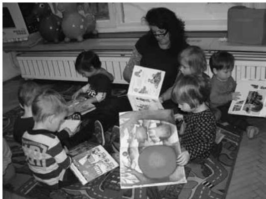
Slika 1: Otroci si radi izberejo svojo slikanico in jo prelistavajo, se ob slikah pogovarjajo in tako plemenitijo besedni zaklad.

Poznavanje različnih dimenzij motivacije, prepoznavanje individualnih razlik med otroki, poznavanje medsebojnega delovanja in vplivanja posameznih dejavnikov motivacije so ključnega pomena, če želimo kot starši, vzgojitelji in učitelji ustvariti osnovo za razvijanje zavzetega bralca. Naš cilj je vzbuditi interes, spodbuditi pozitiven odnos do branja, povečati bralne aktivnosti in bralne dosežke.