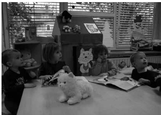
Slika 2: Ob slikanicah se pogovarjamo, spoznavamo nove besede, opisujemo slike in dogajanja na njih.

Otrokov interes za branje pa moramo razvijati skladno z drugimi njegovimi interesi. V vrtcu so otrokom v za to določenih kotičkih v igralnici vedno na voljo knjige, slikanice in revije, saj vsi otroci niso razpoloženi za isto dejavnost ob istem času. Tako se lahko umaknejo v kotičke, kjer listajo, gledajo ilustracije in »berejo« slikanice.