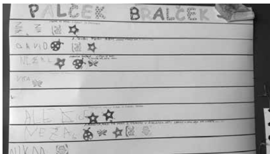
Slika 5: Seznam Palček Bralček

Vzgojiteljica ima po navadi narejen seznam otrok v skupini, ki je na vidnem mestu, in pri imenu otroka, ki je opravil nalogo, da žig ali kak drug znak, za katerega so se predhodno dogovorili. Tako lahko otroci tudi sami spremljajo, kdo je nalogo že opravil in kdo še ne. Za otroke takšno vizualno tekmovanje z vrstniki pomeni dodatno motivacijo.