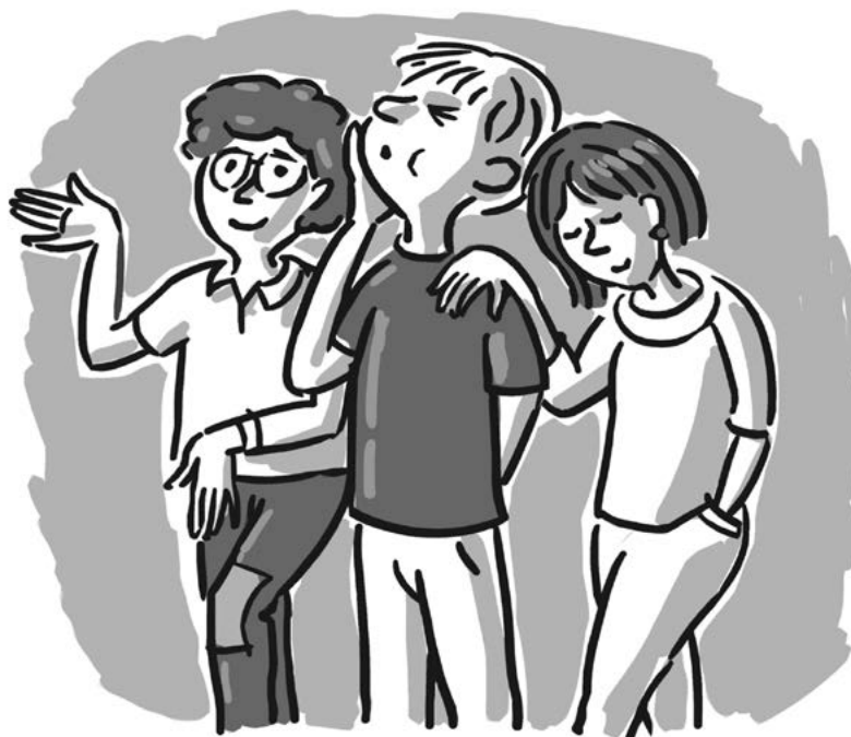
Slika 1: Igra "Detektiv" Ilustracija: Davor Grgičević

posnema kot v zrcalu. V igri »Detektivi« se trije postavijo v zamrznjeno sliko, ki si jo gledalci dobro ogledajo, nato pa zaprejo oči, da vodja igre spremeni tri stvari v sliki (položaj, videz igralcev), gledalci pa ugotavljajo, katere spremembe so bile narejene. Po vaji, namenjeni zavedanju prostora, gibanja in drugih oseb, sta se izvajalki z zbiranjem predlogov otrok o tem, kaj vse potrebujemo za gledališko predstavo, ponovno vrnil k preverjanju znanja otrok o gledališču ter prešli na gledališče kot prostor domišljije. Z vajami za spodbujanje domišljije in ustvarjalnosti (na primer: kako lahko v gledališču pokažemo, da sneži? – odigramo sneg, gradimo snežake) so se otroci spoznali tudi z različnimi izraznimi sredstvi gledališča (igra, scena, rekvizit, animacija lutke, maska, kostum). Pri vaji uporabe izbranega predmeta, ki se lahko skozi igro in gib spremeni v karkoli, in pri animaciji izbranega predmeta v spontanem soustvarjanju zgodbe, so spoznali, da se pomen znaka v gledališču ne sklada nujno s pomenom izven domišljjskega prostora. Pripravo na ogled predstave so zaključili z zbiranjem pričakovanj, s čimer se okrepi tudi njihovo zanimanje in radovednost.