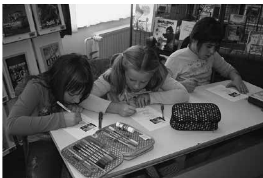
Slika 3: Povratna informacija učitelju