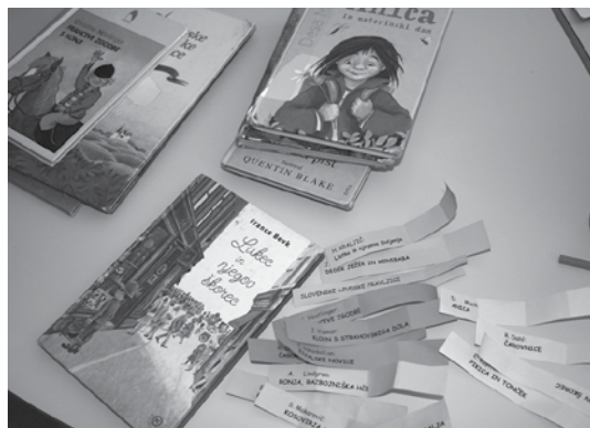
Slika 2: Dokazi o učenju

uspešnosti. Ustno so predstavili kriterije v smislu »Uspešen bom takrat, ko bom našel pravo knjigo s seznama«, »Knjigo bom tiho položil na izposojevalni pult«, »Pri iskanju se bom potrudil sam in preostalih ne bom motil pri iskanju«. Določili sva vrstni red iskanja za skupine. Navodila je bilo treba tudi prilagoditi, da so jih razumeli vsi otroci, saj sta v razredu tudi učenec z okvaro sluha in učenec z motnjo pozornosti. Tema dvema je učiteljica zagotovila individualna navodila. Če bi iskal ves razred hkrati, bi bila prevelika gneča. Učenci so iskali samostojno in bili pri tem večinoma hitri in uspešni. Učiteljica je beležila pravilno najdene