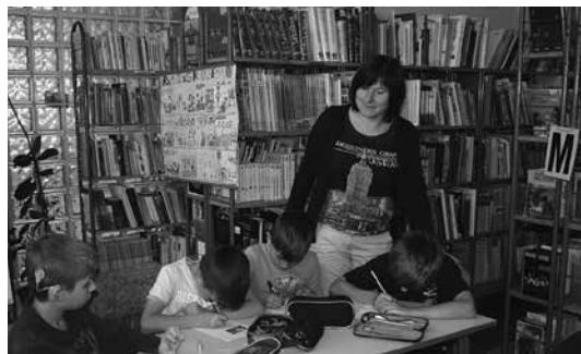
Slika 1: Razlaga navodil

Ugotavljanje predznanja sem vpeljala že v uvodnem delu ure z metodo pogovora. Učenci so našli koticke, ki jih poznajo v knjižnici, in povedali, čemu služijo. Našli in obnovili so pravila obnašanja. Kaj smejo in česa ne smejo početi v knjižnici, so napisali na liste ( priloga 1 ), kar je za naju z učiteljico pomenilo povratno informacijo o tem, kaj so si zapomnili iz ur knjižnične vzgoje prvega VIO.