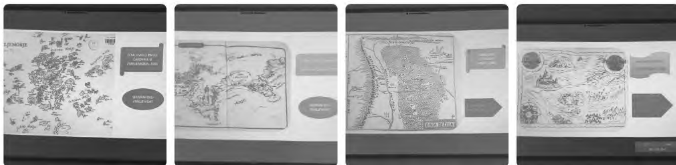
Slika 1: Na fotografijah so prikazani zemljevidi, ki so jih učenci spoznavali pri pouku

pouk. Učenci so prepoznavali gradiva, ki so bila na mizi (atlas, zemljevidi, slikovni atlas, ročni zemljevidi, avtokarte, zgodovinski atlas ...). Med splošnimi cilji KIZ je zapisano, da »učenci z uporabo knjižničnega gradiva in drugih informacijskih virov spoznavajo probleme in se učijo učinkovitih strategij njihovega reševanja. Učenci razvijajo različne spretnosti in sposobnosti, npr. komunikacijske, informacijske, raziskovalne« (Sušec, 2005, str. 6). Med nalogami učnega lista je bila ena, povezana z razstavljenimi gradivi, saj so morali učenci prepisati oz. dopolniti eno od nalepk z gradiva, ki si ga je skupina izbrala. Poiskati so morali tudi oznako oz. polico, kje v knjižnici se nahaja. Vseh oznak niso poznali in niso vedeli, kje se nahajajo, zato so si pomagali z legendo in prostorskim načrtom knjižnice, ki visi na steni knjižnice, ter tako ponovili že usvojena znanja o iznajdljivosti v knjižnici in se hkrati pravilno orientirali v prostoru. UDK-številko z nalepke so razrešili z besedo, ki so jo našli zapisano na legendi in ujema joči se polici (npr. številka 912