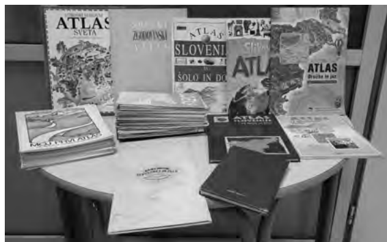
Slika 2: Razstavljeno gradivo za potrebe pouka

Šola v naravi je vsako leto organizirana tako, da se v projektnem tednu zvrsti veliko dejavnosti, kjer učenci nadgradijo teoretično znanje s praktičnim delom.