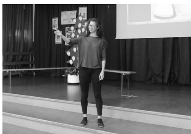
↳ Slike 1-4: V odrski igri se dijaki sprašujejo, zakaj je sploh treba brati Cankarja.

Ob vsakem namigu na določeno črtico se je na platnu nad odrom predvajal kratki film (sedem kratkih filmov dolžine 1–3 minute). Učenci na odru so govorili delno v slengu, delno v splošno pogovornem slovenskem jeziku. V igro sem bila vključena tudi sama, in sicer kot učiteljica, ki v parku sreča svoje učence, dva učenca pa se pred njo skrivajeta za drevo (namig na črtico Mater je zatajil).