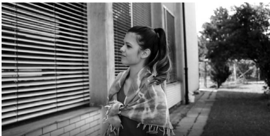
▼ Slika 7: Cankarjeva mati zaman čaka pred šolo