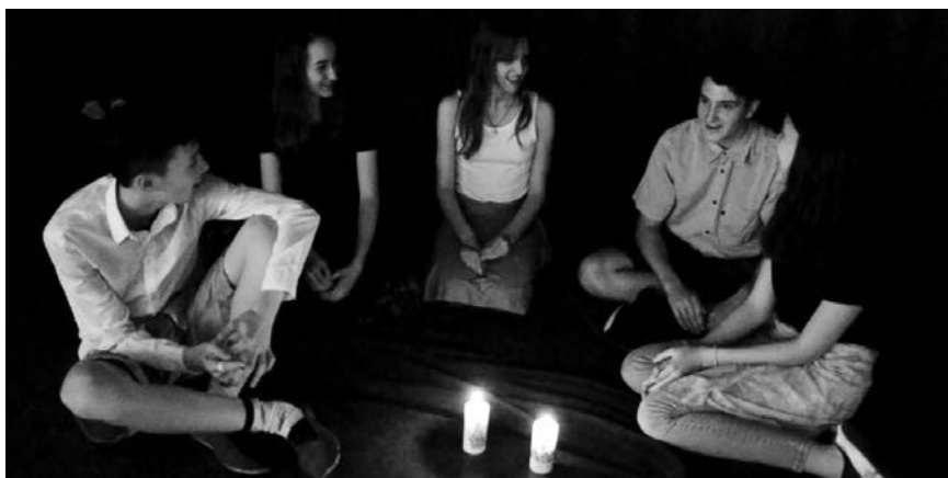
▼ Slika 8: Otroci med pogovorom na peči