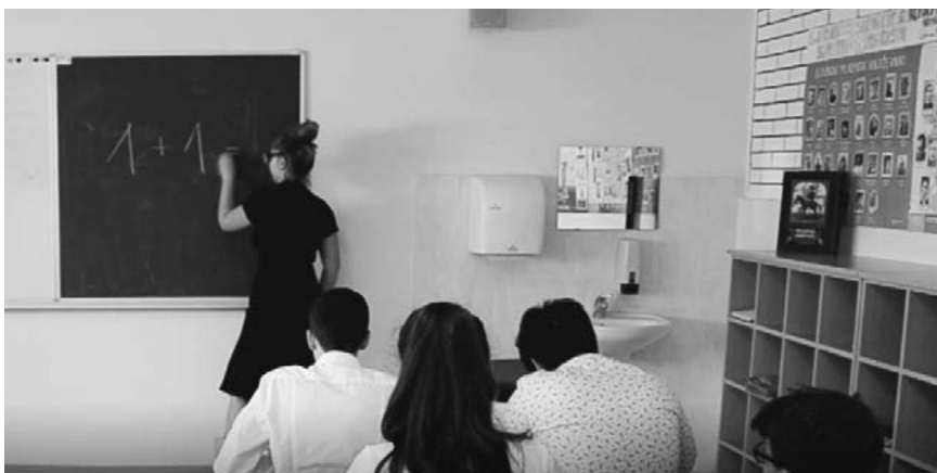
Slika 11: Stroga učiteljica sprašuje, koliko je 1+1