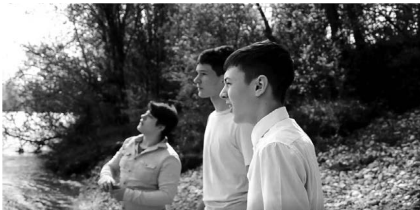
▼ Slika 5: Cankar s prijatelji ob reki