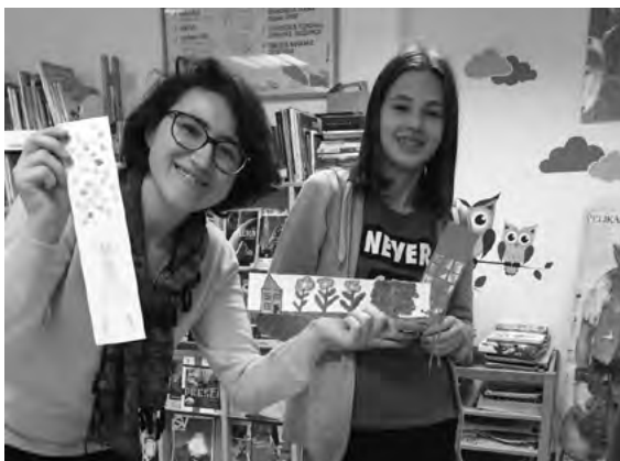
Slika 3: Veselje ob prejetih kazalkah iz Litve