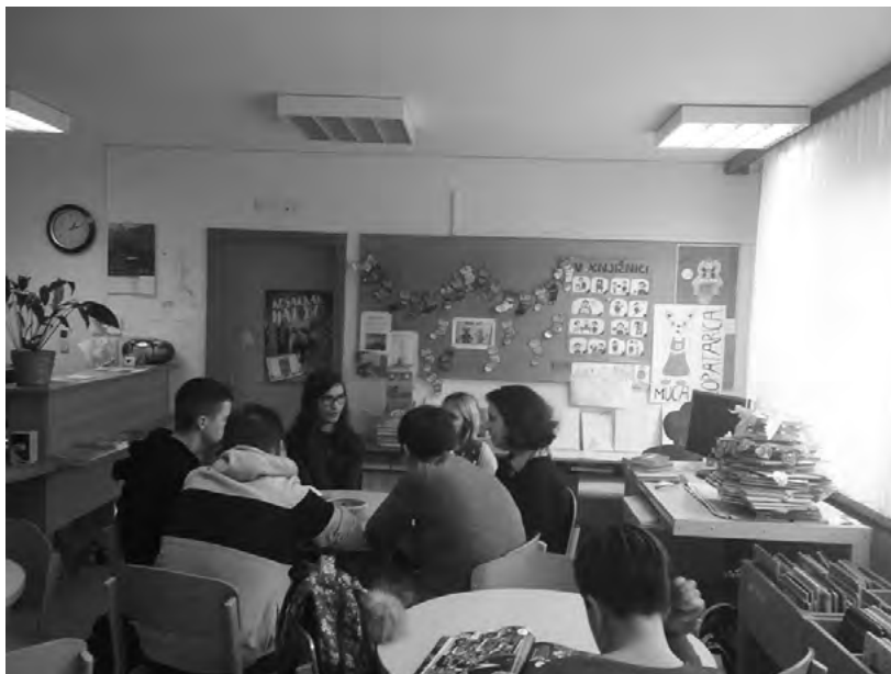
Slika 1: Dejavnost Reading Club v šolski knjižnici

Ob zaključku šolskega leta je povedala, da ji je delo na naši šoli pripomoglo k odločitvi o smeri nadaljnega izobraževanja in s tem je bila naša »naloga« več kot uspešno opravljena.