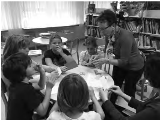
Slika 2: Medgeneracijsko sodelovanje v šolski knjižnici OŠ Tončke Čeč