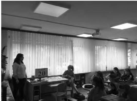
Slika 5: Španščina za šestošolce

Sodelovanje v tovrstnih projektih pozitivno vpliva tako na šolsko kot tudi na lokalno skupnost; bolj se zavedamo naše raznolikosti, kar nas lahko samo bogati.