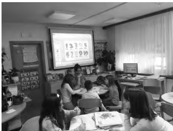
Slika 6: Španščina za drugošolce