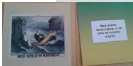
Iskanje parov