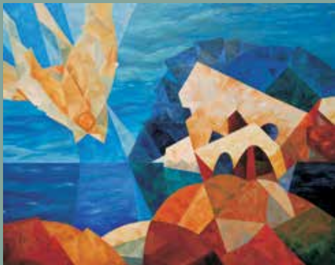
Rrroza, 2014, Ikarjev padec