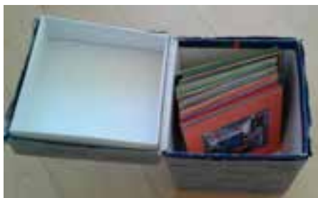
Spomin – priprava igralnih kartic