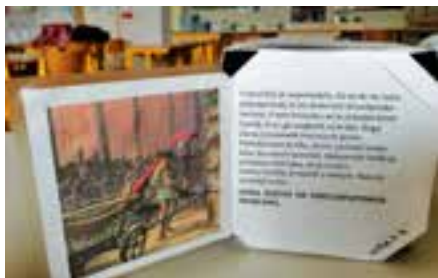
Stranica kocke se odpre, na notranji strani je napisana kratka razlaga in dodana slika gesla.