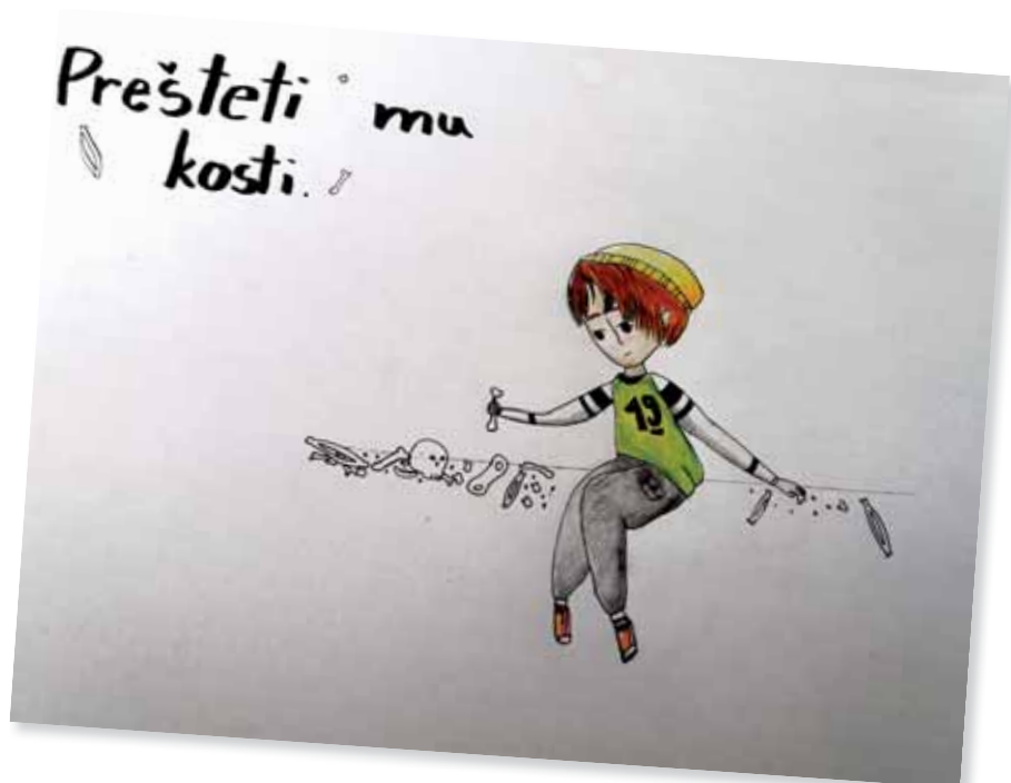
Slika 3: Ilustracija Prešteti mu kosti. Avtorica: Ana Karin Rome