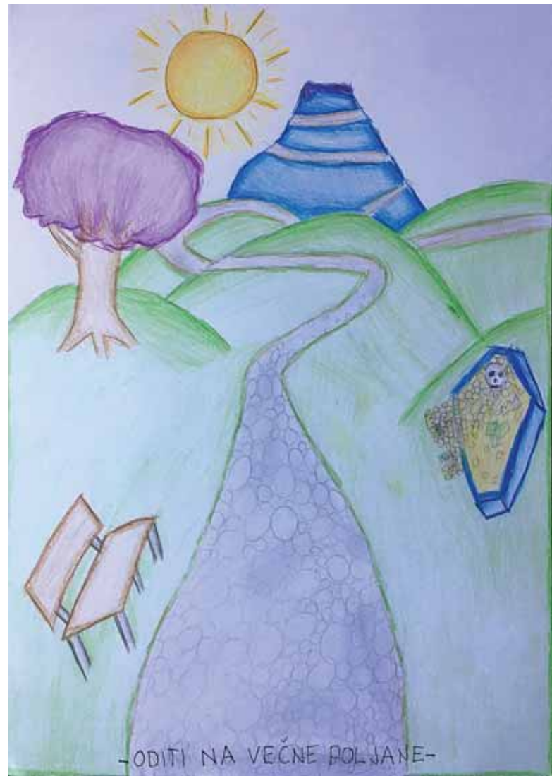
Slika 2: Ilustracija Oditi na večne poljane. Avtorica: Lucija Malovrh

Zadnja naloga je od učencev zahtevala likovne sposobnosti, saj so morali izbrati en frazem in ga dobesedno narisati. Iz ilustracije so razbrali, da preneseni pomen pokaže to, kar je sporočilo frazema.