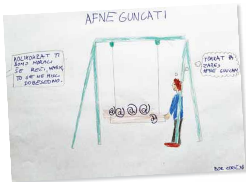
Slika 4: Ilustracija Afne guncati. Avtor: Bor Zorič

Delo na daljavo je od učiteljev zahtevalo veliko učenja, raziskovanja in inovativnosti, kako vsebine obravnavati in približati učencem. Vsi se zavedamo, da se učenci največ naučijo, če so pri pouku aktivni in jim učenje osmislimo. Vse vsebine v prispevku so učenci delali individualno. Če bi pouk potekal v šoli, bi učenci vse vsebine delali v skupini, se med seboj povezovali, sodelovali in medvrstniško vrednotili svoje izdelke. S takim načinom dela dobimo veliko izdelkov, ki se jih lahko objavi v šolskem glasilu.