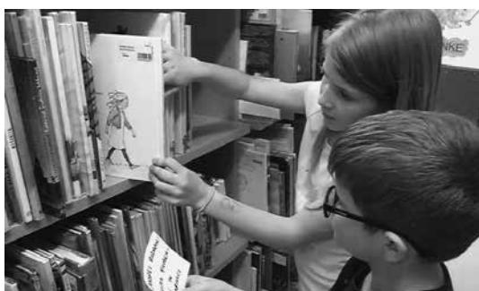
Slika 3: Iskanje gradiva

Natančno sem jim razložila, kako bodo iskali slikanice, ki so bile zapisane na listkih. Najprej bo le en učenec v paru iskal knjigo, drugi pa ga bo samo opazoval, ne bo mu pomagal, lahko mu bo le držal listek. Kasneje bosta dobila drug listek in svoji vlogi zamenjala.