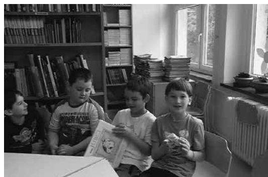
Slika 4: Medvrstniško vrednotenje

Ko je učenec iskalec našel knjigo (dokaz učenja), mu je učenec opazovalec posredoval povratno informacijo. Pomagal si je s kriteriji uspešnosti, ki so jih med učno uro tvorili in zapisali na plakat. Ker učenci niso imeli še nobenih izkušenj s podajanjem povratne informacije, sem jim morala pomagati z vprašanji in usmerjanjem na plakat. Povratna informacija je bila na primer taka: »Začel si iskati v pravem delu knjižnice, vendar si se najprej premaknil do napačne police, ker si iskal po začetnici imena, ne priimka avtorja. Nato si ...«