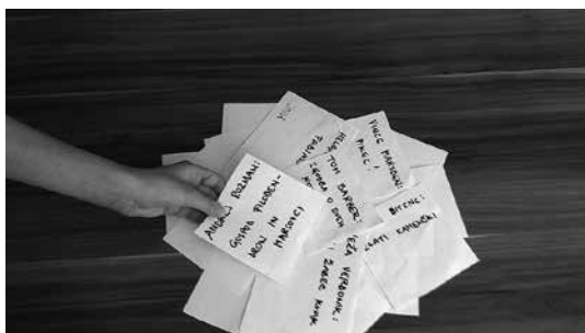
Slika 2: Listki za iskanje knjig

V nadaljevanju ure so učenci najprej izžrebali listke, s pomočjo katerih so se razdelili v pare, nato je vsak par izžrebal tudi listek za iskanje gradiva.