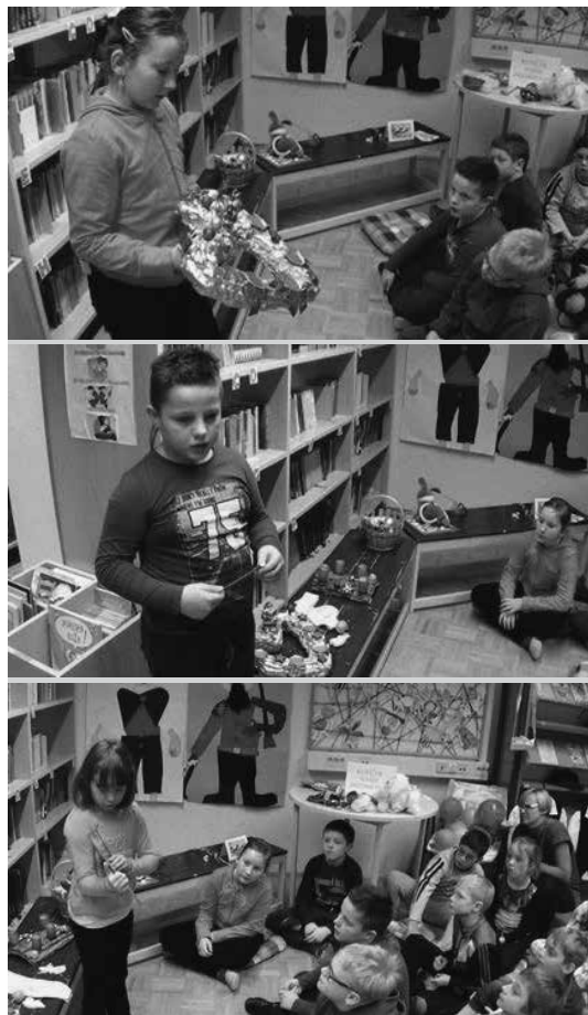
Slike 1, 2 in 3: Predstavitev prazničnih predmetov

Odločili sva se za obravnavo praznikov, saj tej temi učenci po učnem načrtu v prvem in tudi drugem VIO namenijo veliko ur, tematika je povezana z vsakdanjim življenjem in pomembna v čustvovanju otrok.