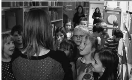
Sliki 7 in 8: Sprehod po knjižnici in predstavitev literature o praznikih

Izjemno pomemben cilj KIZ je učenca usposobiti kot samostojnega iskalca literature v šolski knjižnici, zato se mi je zdelo smiselno preveriti, kako učenci ocenjujejo svojo zmožnost iskanja literature. Vpeljala sem element formativnega spremljanja, s katerim bi učenci oblikovali kriterije uspešnosti za iskanje literature v šolski knjižnici (Holcar Brunauer