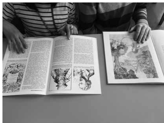
Slika 7: Pregledovanje gradiva v povezavi s Trubarjem za domačo nalogo