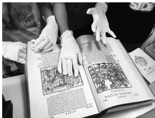
Slika 4: Listanje in pregledovanje Dalmatino Biblije

Med uro so lahko prelistali in se dotaknili tudi ostalih gradiv, ki jih hrani naša knjižnica. Zanimiva vprašanja so imeli o Brižinskih spomenikih ter bibliofilski izdaji Biblije (predvsem glede pozlate strani in ključavnice).