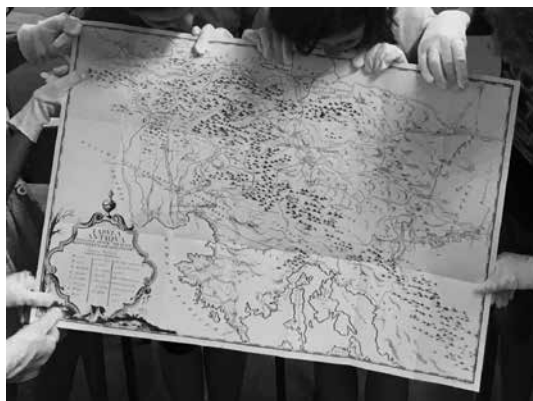
Slika 3: Učenci so si z zanimanjem ogledali starinski zemljevid – takratno podobo dežele.

Nato sem njihove poglede usmeril k pultu, k pripravljenu gradivu. Najprej sem pokazal Zemljevid Kranjske dežele, ki so ga zaradi velikosti prijeli in pridržali učenci, tako da so ga vsi videli, sam pa sem podal razlago ter hkrati pokazal tudi Valvasorjevo berilo ter bibliofilsko izdajo Slave vojvodine Kranjske. S tem smo ponovili učencem že znano snov o Valvasorju.