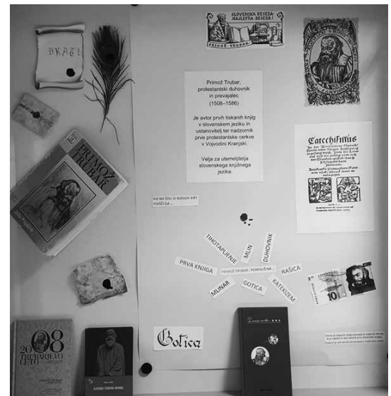
Slika 1: Razstavna vitrina o Primožu Trubarju