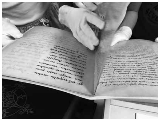
Slika 5: Občudovanje Brižinskih spomenikov

Med uro so lahko prelistali in se dotaknili tudi ostalih gradiv, ki jih hrani naša knjižnica. Zanimiva vprašanja so imeli o Brižinskih spomenikih ter bibliofilski izdaji Biblije (predvsem glede pozlate strani in ključavnice).