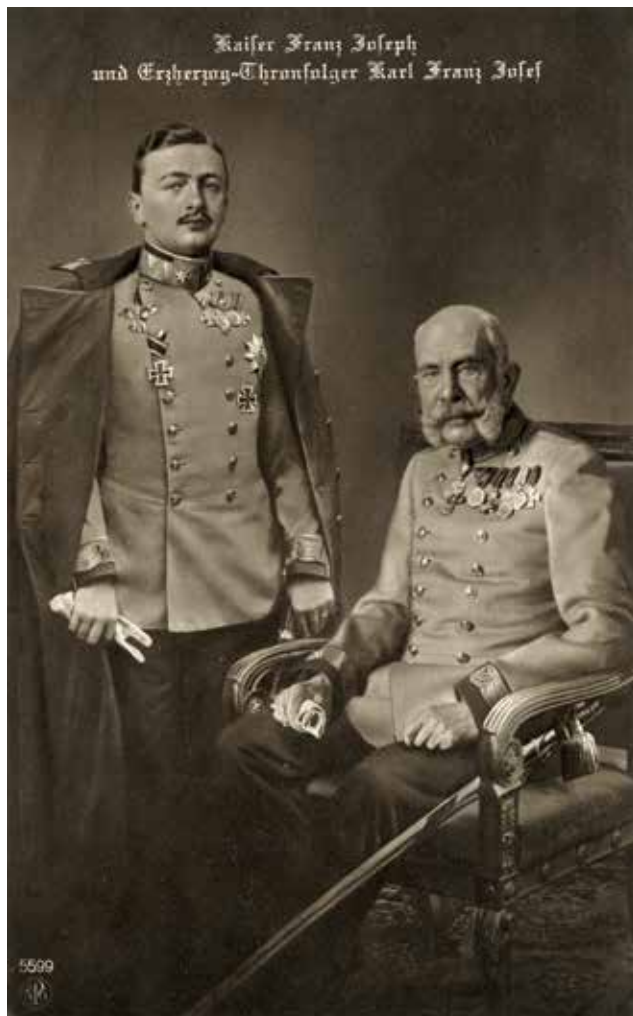
Cesar Franc Jožef in prestolonaslednik Karel Franc Jožef.