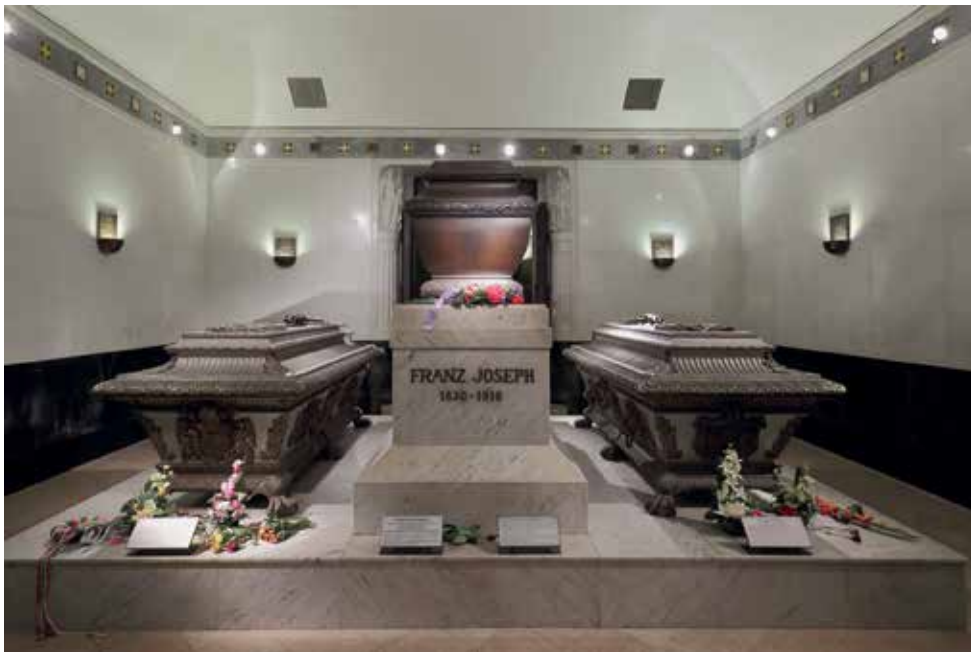
Grobnica cesarja Franca Jožefa v Kapucinskem samostanu na Dunaju, levo od cesarjevega sarkofaga je sarkofag cesarice Elizabete, desno pa kronskega princa Rudolfa.