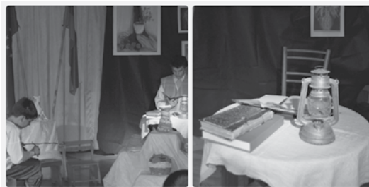
Slika 2: Prizora iz predstave.

Učenci se pri pouku slovenščine, doma in v šolski knjižnici pripravljajo na dramski nastop. Vse pripravljene točke so odigrali pri pouku, ena izmed izvedb pa je bila vključena v šolsko proslavo ob slovenskem kulturnem prazniku, kjer na sliki v ozadju vidimo odraslega Voranca, ki sedi za mizo, premišljuje, piše spomine iz svojega otroštva, pred njim pa se odvija prizor, kako je kot majhen deček sedel na paši in pozdravil mimoidočega v nemščini in ne v slovenščini. Razlog za to je bilo učiteljevo vztrajno prigovarjanje, da morajo uporabljati nemščino (slika 2). Del besedila so posneli in na proslavi predvajali. Za vlogo učencev so pri nastopu zaprosili prvošolčke.