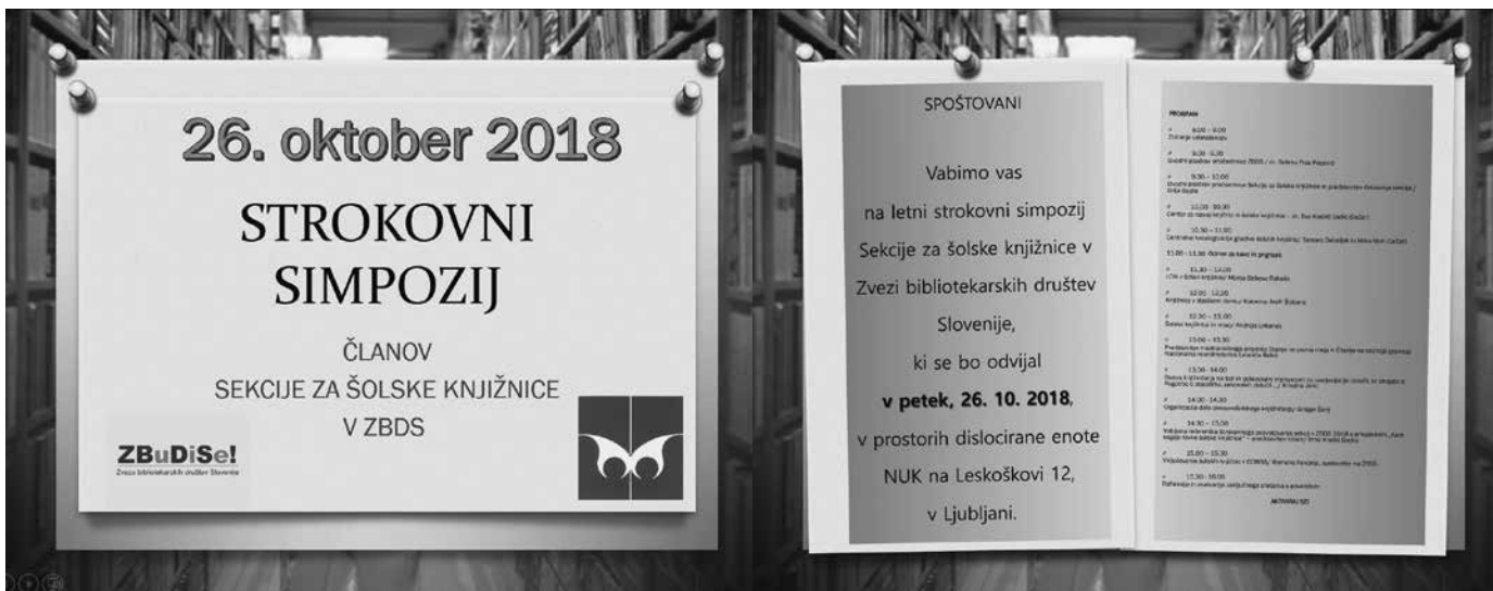
Slika 5: Vabilo na strokovni simpozij Sekcije za šolske knjižnice