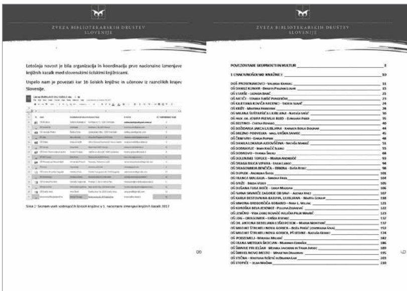
Slika 3: Publikacija Mednarodni mesec šolskih knjižnic 2017

dne – International School Library Bookmark Exchange). V prvem letu je sodelovalo 16 šol, tj. šolskih knjižnic.