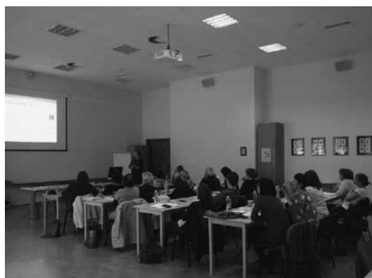
Slika 6: Udeleženci strokovnega simpozija