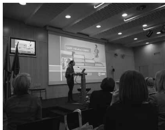
Slika 8: Aktivno na konferenci Cobiss 2018

Mnogi člani sekcije, ki se tega strokovnega dogodka niso uspeli udeležiti, so izrazili