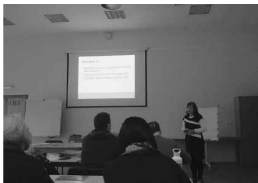
Slika 7: Strokovno sodelovanje Sekcije za šolske knjižnice s svetovalko za šolske knjižnice na ZRSŠ

željo, da bi si lahko ogledali/prebrali gradivo. Razmišljali smo, kam to gradivo (PP-projekcije) postaviti, da bi bilo dosegljivo, a do rešitve nismo prišli. Pred leti smo že oblikovali svojo spletno stran, pa se je potem zapletlo s skrbništvom, prav tako se ne zdi smiselno, da se preveč drobimo na posamezne segmente ... skratka, želimo si, da bi bil prostor za te stvari na spletni strani ZBDS, kjer ima naša sekcija že svoj »kotiček«.