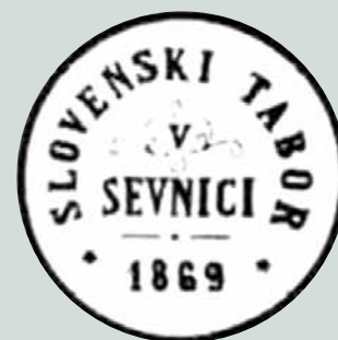
Spominska značka tabora v Sevnici 2. 5. 1869.

(Vir: https://www.obcina-sevnica.si/zanimivosti/tabor-v-sevnici , dostop: 5. 4. 2019.)