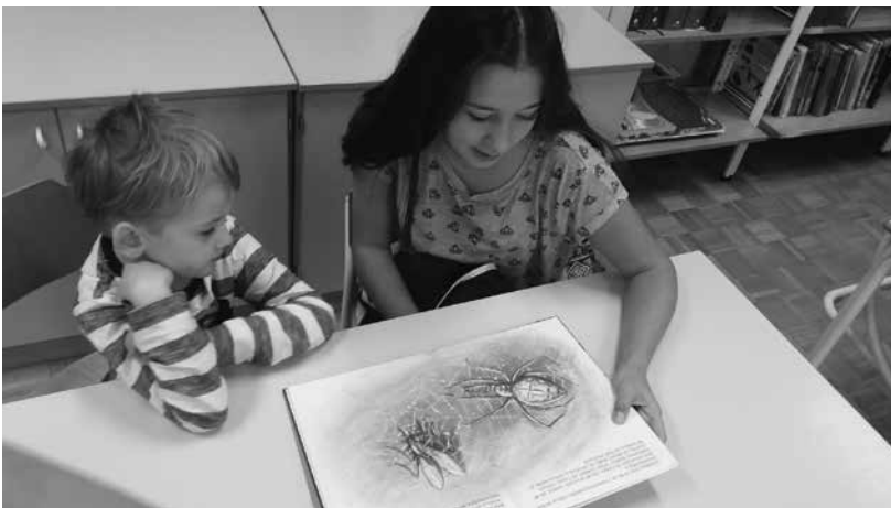
Slika 2: Bralni prijatelj

k težjim, od bolj pogosto do manj pogosto rabljenim.