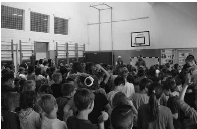
Slika 5: Zaključek bralnih značk, kjer sodelujejo znani slovenski pisatelji in pesniki