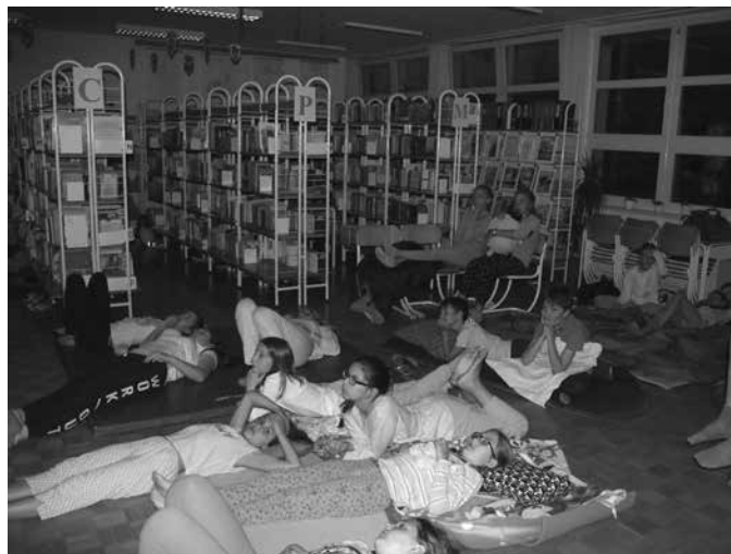
Slika 4: Noč v knjižnici