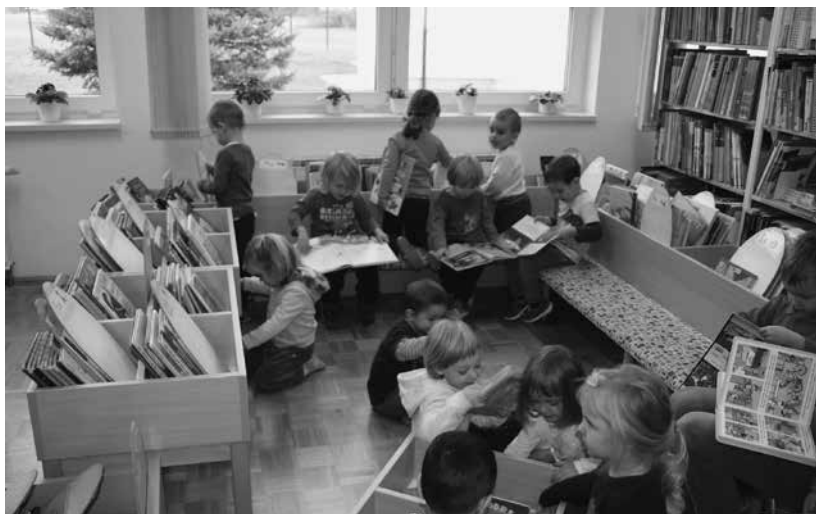
Slika 1: Predšolski otroci obiskujejo šolsko in splošno knjižnico