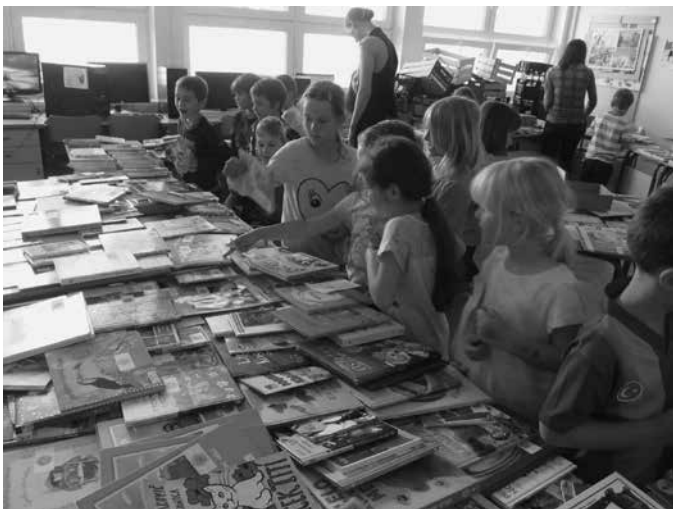
Slika 3: Menjava knjig za gumb