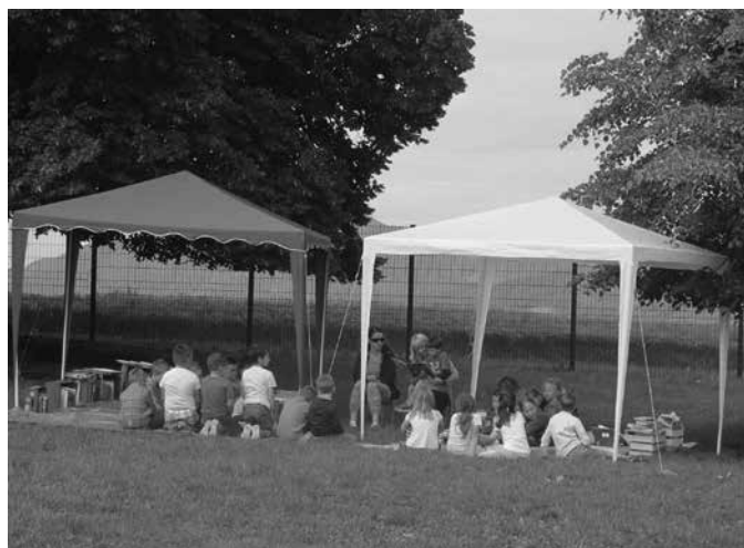
Slika 6: Branje na prostem