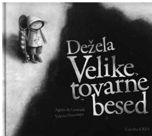
Slika 1: naslovnica knjige Dežela Velike tovarne besed