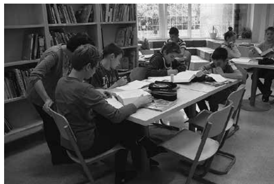
Slika 1: Delo s slovarji po skupinah

Ugotavljanje predznanja je element, iz katerega izhajamo, če želimo, da učenci dosežejo zastavljeni cilj, torej uspešno opravijo zastavljene naloge in pridobijo novo znanje oz. utrdijo že obravnavane vsebine. Ob vključitvi v razvojno nalogo sem se odločila, da bom za začetek posebej pozorna na element samovrednotenje. Elementi formativnega spremljanja se med seboj prepletajo in tako postopoma vključujem tudi druge. Učenec, ki ne pozna ciljev in krite-