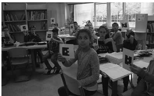
Slika 2: Učenci odgovarjajo preko aplikacije Plickers