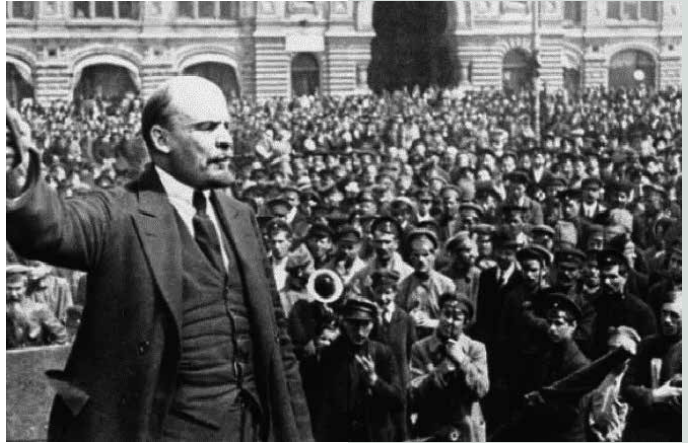
Lenin govori pred množico.

O tem, kakšno mnenje o ruskem oktobru je bilo uveljavljeno med ljudmi, lahko le ugibamo, a sklepajoč po tem, da so bile njegove prvine vtkane tudi v jugoslovansko revolucijo, lahko trdimo, da mu je bilo naklonjeno. V javnomnenjskih anketah, ki so jih v Sloveniji izvajali od leta 1968 (kar je bil edinstven primer na evropskem Vzhodu), po tem niso spraševali, je pa povedno, da se je Sovjetska zveza kot država po svojih lastnostih in priljubljenosti vseskozi uvrščala zelo visoko. 20