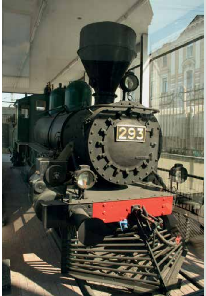
Lenin se je vrnil v Rusijo z vlakom, ki ga je vlekla lokomotiva na sliki, sedaj razstavljena v Sankt Petersburgu.

Tedaj se je zamajal uveljavljeni politični red, izbruhnili je »svetovna revolucija vzhajajočih pričakovanj«, ki se je sčasoma dotaknila skrajne točke zemeljske oble. Vojna, nacionalna gibanja, socialno/razredno nezadovoljstvo so delovali razkrajajoče in ustvarjalno obenem, odpirali so nove možnosti, navdihovali nova razmišljanja, oblikovali nove mentalne svetove.