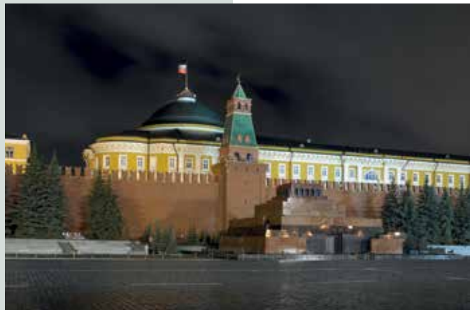
Leninov mavzolej pred Kremljem.