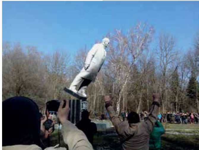
Odtranjevanje Leninevega spomenika.

– politični, demografski in socialnoekonomski. Zaradi obsežnih premikov prebivalstva in številnih beguncev se je precej spremenila prebivalstvena struktura, ruska izkušnja je spodbudila izboljšanje socialne zakonodaje, povrhu vsega pa so nemški industrijski sovjeti, ki so se oblikovali v tovarnah, preživel do današnjih dni in še vedno predstavljajo institucionalni steber nemškega sistema socialnotržne ekonomije (to imenujejo Paritätische Mitbestimmung). V nemški ustavi, sprejeti po prvi svetovni vojni (weimarska ustava), je bil vsebovan celoten razdelek, posvečen socialnoekonomski problematiki, kar je bila takrat velika novost. Pod vtisom tega poglavja weimarske ustave so nekaj kasneje tudi v jugoslovanski ustavodajni skupščini leta 1921 sprejeli takšno ustavo (vidovdanska ustava), ki je zelo podobno (včasih dobesedno) urejala pravice delavcev. Posreden vpliv ruske revolucije je bil nedvomno prostorsko in časovno daljnosežen.