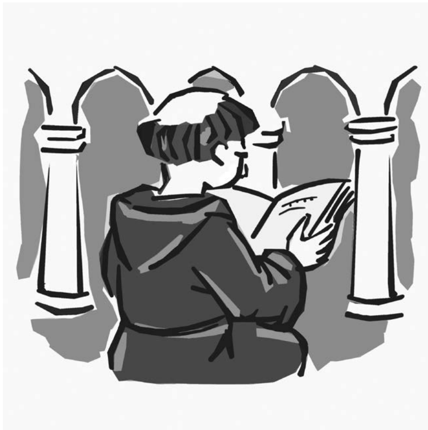
↘ Slika 1: Stanislav Škrabec je bil redovnik, znanstvenik, jezikoslovec, ki je v lastnem časopisu neodvisno objavljala svoja raziskovalna spoznanja o individualnem razvoju slovenskega jezika.

narjem in piscem. To so bili teolog in jezikoslovec Jan Hus (1370/71-1415), začetnik znanstvene slavistike in češkega preroda Josef Dobrovský (1763-1829), jezikoslovec in literarni zgodovinar Josef Jungmann (1773-1847), slovaški češko piščoči jezikoslovec, literarni zgodovinar in etnograf Pavel Josef Šafařík (s prvotnim imenom Pavol Jozef Šafárik) (1795-1861), pesnik in folklorist Karl Jaromír Erben (1811-1870) ter jezikoslovec in visokošolski učitelj Jan Gebauer (1838-1907). Škrabec je dobro poznal njihova dela in jih v svojih besedilih tako ocenjeval, kot tudi citiral. Sklicevanja na češke raziskave in stališča nista povzročala avtorjeva nesamozavest ali dvom, ampak iskanje in izpostavljanje znanstveno utemeljene resnice.