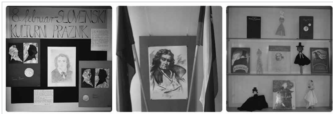
Slika 1: Razstave izdelkov, ki nastanejo pri pouku in dopolnjujejo kulturni praznik.

Od 6. do 9. razreda pa Prešerna obravnavajo pri slovenščini, saj je v učnem načrtu in berilu, ter pri drugih predmetih (zgodovini, angleščini, likovni in glasbeni umetnosti ter pri domovinski in državljski kulturi in etiki). Književno delo obravnavajo pri medpredmetnem povezovanju s šolsko knjižnico, kjer učenci uporabljajo tudi različne IKT-pripomočke za branje ter pregledovanje literature o