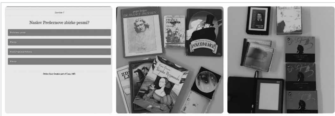
Slika 2: Prva slika prikazuje uvodni spletni kviz, ki so ga reševali učenci. Naslednji dve sliki prikazujeta pripravljeno gradivo na mizah.