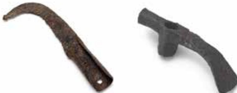
Rimsko kmetijsko orodje: vejnik in sekira.

Vila rustica je rimska podeželska vila, posest bogatega rimskega naseljence, namenjena občasnemu bivanju in gospodarskemu izkoriščanju. Stavba, odkrita v Radvanjah na Mariborskem polju, je ena izmed številnih vil rustik, doslej odkritih na območju Slovenije. Stala je ob pomembni obdravski cesti. Njeni temelji so ohranjeni in urejeni kot arheološki park. Pri arheoloških izkopavanjih so odkrili tri večje gospodarske objekte, ki so verjetno služili za shranjevanje žita in hleve. Arheologi so odkrili tudi dva stanovanjska objekta, ki sta bila od gospodarskega dela ločena z dvo-