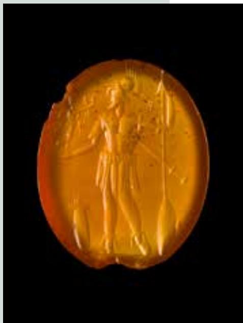
Gema (nekoč vdeta v prstan) z upodobitvijo boga vojne, Marsa, ki v roki drži boginjo zmage, Viktorijo. (Hrani: Mestni muzej Ljubljana. Foto: Andrej Peunik, MGML.)

Rimska umetnost, ki je bila dedinja helenistične umetnosti, se je na ozemlju današnje Slovenije pod okriljem rimske države hitro razširila. Mesta so bila bogato okrašena s napisi in kipi cesarjev, zaslužnih posameznikov in bogov. V umetniškem ustvarjanju so imeli pomembno vlogo kiparji in kamnoseki; nagrobne spomenike za pripadnike visokega in srednjega sloja so izdelovali najboljši provincialni umetniki. Številni ostanki fresk