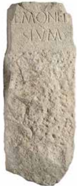
Mejnik med mestnima območjema Akvileje in Emone, odkrit pri Bevkah na Ljubljanskem barju. (Hrani: Narodni muzej Slovenije. Foto: Tomaž Lauko.)

Mesto je bilo zgrajeno v pravokotnem tlorisu, s pravokotno sekajočimi se cestami, med katerimi so bile hiše, v sredini mesta pa glavni trg – forum. Obzidje, ki je za mesto predstavljalo poleg varnosti pred morebitnim sovražnikom predvsem prestiž, je bilo pravokotno, imelo je 26 stolpov, s treh strani pa ga je ščitil tudi dvojni jarek, po katerem je tekla voda, ki se je stekala v Ljubljanico. Poleg štirih glavnih vhodov je bilo za lažji vhod v mesto in iz njega vsaj še deset stranskih. Zunaj mesta so se ob glavnih vpadnicah