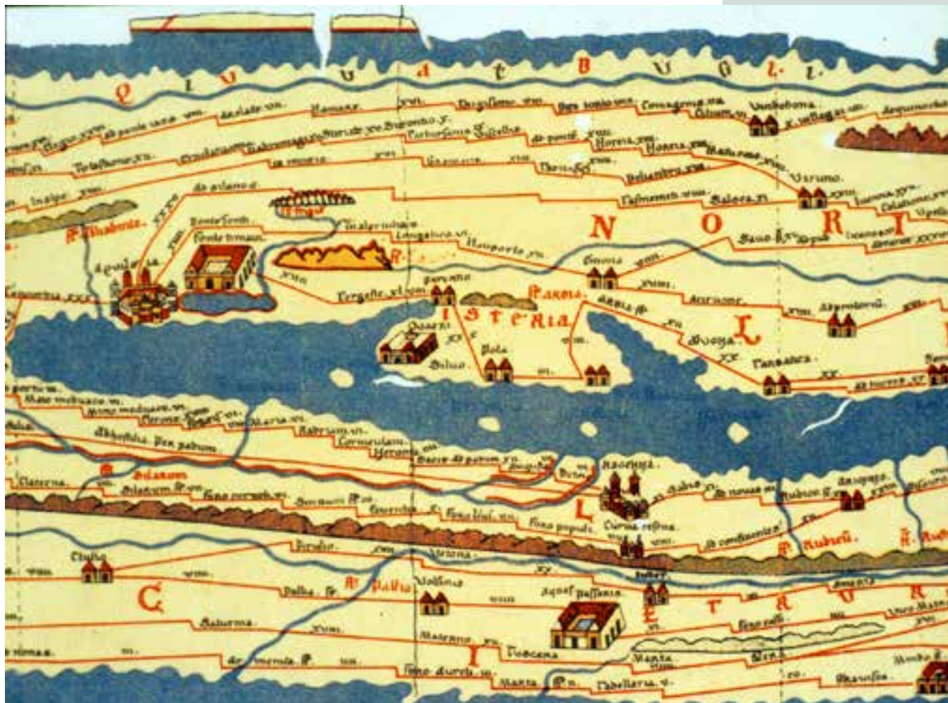
Tabula Peutingeriana: zemljevid rimskega sveta z mesti in drugimi naselji ter cestnim omrežjem med njimi. Izrez v sredini, nad istrskim polotokom, prikazuje območje današnje Slovenije.