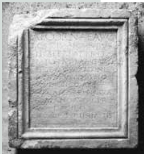
Kamnitno podnožje kipa s posvetilom boginji Ekorni. (Hrani: Mestni muzej Ljubljana. Foto: E. Primožič, Matevž Paternoster, MGML.)