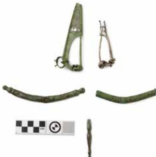
Deli noriško-panonske noše. Zgoraj dve sponki za spenjanje obleke na ramenih (leva bronasta, desna srebrna), v sredini dva pasna okova, spodaj del, ki je krasil zaključek pasu. (Hrani: Mestni muzej Ljubljana. Foto: Andrej Peunik, MGML.)

Vseeno pa so staroselski prebivalci območja današnje Slovenije še dolgo v rimski čas zadržali nekatere svoje navade, verovanja in tradicije. Tako so na delu Dolenjske in v Beli krajini za pokop upepeljenih pokojnikov iz gline izdelovali žare v obliki hiš. Na širšem območju Štajerske, Dolenjske in osrednje Slovenije pa nekatera dekleta in žene niso sledile rimski modi oblačenja. Raje so se oblačile po svoje: čez nagubano spodnjo obleko z dolgimi rokavi so nosile krajšo obleko brez rokavov, ki so jo spenjale z zaponkami posebnih oblik in včasih prepasale s posebej oblikovanim pasom. Tak način oblačenja je zaradi razširjenosti po provincah Norik in Panonija dobil ime noriško-panonska noša.