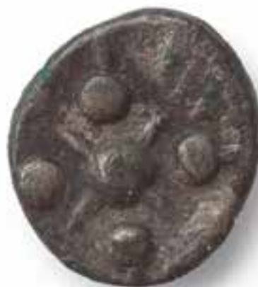
Keltski novc – srebrnik. (Hrani: Mestni muzej Ljubljana.)

Potem so Rimljani začeli napredovati v kraje v širšem zaledju Akvileje. To je bil pomemben prehodni prostor med tedanjo Cisalpinsko Galijo, ki je bila od okoli leta 90 do 42 pr. n. št. provinca in nato del Italije, in Noriškim kraljestvom. Obsegal je del današnjega Krasa, prelaz Razdrto, Postojnska vrata in Emonsko kotlino. Rimljani so si že zgodaj prizadevali, da bi ga