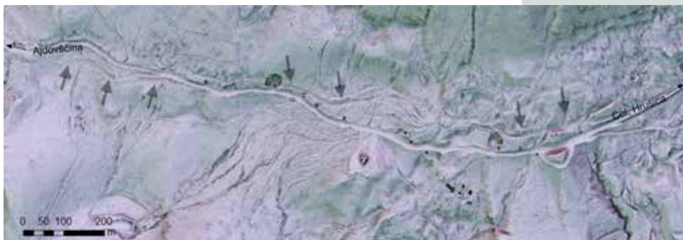
Posnetek v avgustejskem času zgrajene hitre ceste čez Hrušico, narejen s pomočjo laserskega skeniranja površja.