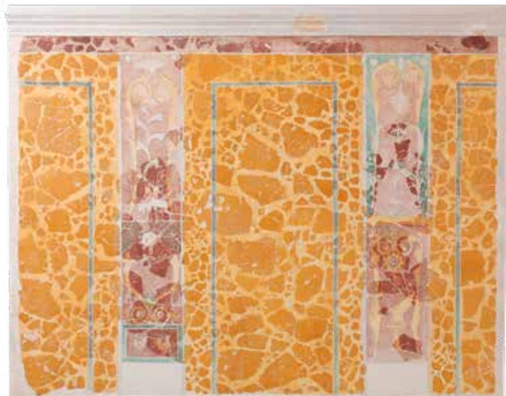
Stenska poslikava iz emonske insule 17. (Hrani: Mestni muzej Ljubljana. Foto: Matevž Paternoster, MGML.)

in štukatur kažejo, da je bilo zelo priljubljeno tudi okraševanje sten in stropov. Za freske iz 1. in 2. stoletja je značilno, da so stenske ploskve razdeljene na več pravokotnih polj, na katerih so majhni figuralni prizori. V 3. in 4. stoletju so velike površine krasili z geometrijskimi vzorci. Tla so pogosto olepšali z mozaiki. Sprva so bili najbolj priljubljeni mozaiki z geometrijskimi vzorci, ki so se k nam razširili iz Italije; ob koncu 2. stoletja so se uveljavili ornamentalni in figuralni mozaiki.