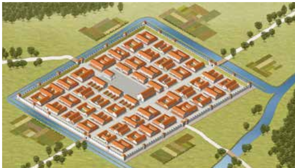
Rekonstrukcija mesta Emone. (Avtor: Igor Rehar, VOKA, MGML.)

Emona je zelo staro ime, saj izvira še iz predkeltskih časov. V pozni bronasti in starejši železni dobi je naselje ležalo na Grajskem hribu, umrle pa so pokopavali na drugi strani Ljubljanice. Prav plovna Ljubljanica in lega na križišču poti je bila ključna za razvoj naselbine, prek katere so potekali trgovski stiki s Segesto (rimska Siscija/današnji Sisak), pomembnim prazgodovinskim trgovskim naseljem Segestanov, ter ob jantarjevi poti, ki je vodila prek Petovione in Karnunta (Petronell pri Dunaju) proti Baltskemu morju. V 1. stoletju pr. n. št. so pod Grajskim hribom stale preproste hiše, grajene iz lesa in ilovice, v katerih so živeli predkeltski staroselci, verjetno pomešani s Tavriski. Sredi 1. stoletja pr. n. št., ko so Rimljani že nadzorovali Ljubljansko kotlino, so se sem začeli naseljevati prvi Rimljani, akvilejski trgovci in podjetniki. Rimska Emona, ustanovljena kot Colonia Iulia Emona , je bila proti koncu Avgustove vladavine zgrajena po rimskih urbanističnih načelih. Gradbeni napis iz jeseni leta 14 oziroma iz začetka leta 15, ki ga je dal postaviti Tiberij tudi v imenu nedavno umrlega cesarja Avgusta, govori o večji javni gradnji, verjetno o gradnji obzidja. V novo mesto so naselili koloniste: civiliste iz severne Italije in posamezne odslužene vojake, ki so kot odpravnino dobili rodovitno zemljo v okolici Emone.