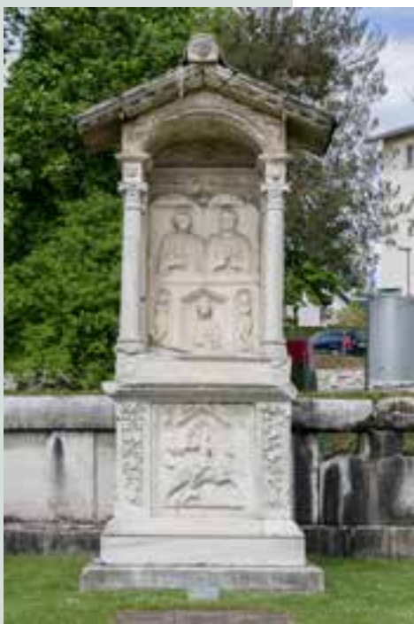
Grobnica družine Enijcev, iz 2. stoletja, v Šempetru v Savinjski dolini.

Mesto so upravljali aristokrati Vindoniji, Beliciji, Spektaciji in drugi. Nekaj uglednih družin je živelo v manjši vasi na prostoru današnjega Šempetra v Savinjski dolini, kjer je bila izkopana nekropola z marmornimi grobnicami, okrašenimi z reliefi z mitološkimi prizori in s kipi celejanskih pomembnežev. Grobnice so se ohranile zaradi katastrofalne poplave Savinje v drugi polovici 3. stoletja, ki je poškodovala tudi Celejo, in so danes na ogled kot arheološki park.