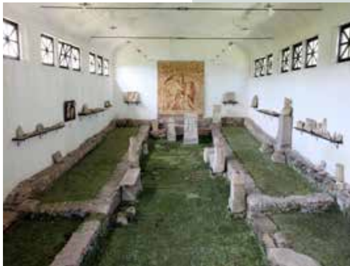
Rekonstruiran 3. mitrej na Ptuj, na Zgornjem Bregu.

Petoviona je bila vplivno upravno, obrtniško in trgovsko mesto s kmetijskim zaledjem; ocenjujejo, da naj bi imela vsaj 20.000 prebivalcev. Ležala je na obeh bregovih Drave,