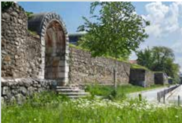
Ohranjeno in po načrtih arhitekta Plečnika nadzidano emonsko obzidje na Mirju, pogled z zahodnega vogala proti vzhodu.

razprostirala obsežna pokopališča, razen proti jugu, kjer je bil teren zamočvirjen.