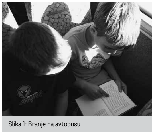
Slika 1: Branje na avtobusu

Strinjali pa so se tudi, da je prijetno in navdušujoče tudi poslušanje. Prvo bralno gostovanje so zaključili z zmago na Bledu. Naslednja knjiga je bila Blazno resno o seksu iste avtorice. Mentorji Bralne značke na šolah, ki jih obiskujejo otroci, so hokejistom, če so bili vključeni v projekt Bralne značke, priznali opravljene obveznosti v obsegu dveh knjig. V knjižnici smo jim pripravili potrdila o sodelovanju ter ustrezen dopis, s katerim smo predstavili projekt. Mariborska knjižnica je ob sodelovanju s Hokejsko drsalnim klubom Maribor tako v