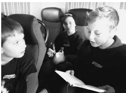
Slika 2: Ko sotekmovalec bere, ga drugi pozorno poslušajo.

Razprava se je ustavila pri razlikovanju besed hinavec in zahrbtnož . Ločevanje teh dveh besed smo povezali s posameznikovim dejanjem, ki ne odraža tega, kar dejansko misli o tebi. Ali ti laže v obraz ali za hrbtom. Ker je življenje že od vsega začetka pač življenje, so otroci nizali prigode iz svojih življenj v ilustracijo pomenskega razlikovanja dveh besed. Sabijevo potovanje v svobodo opredeljuje denar. Ko v zgodbi našteva valute, smo se hitro ustavili pri pojasnjevanju, kaj sta lira in funt , nato še pri izkoriščanju ljudi in besedi značaj (ugotavljanje razlike med tistimi lastnostmi, ki označujejo posameznika predvsem v odnosu do drugih in okolice in lastnostmi posameznika). Pogovor o zgodbi se je v nadaljevanju navezal na očetovo vlogo v zgodbi in na njegovo podporo Anejevi pomoči Sabiju ter ponovno na to, kako postati dober bralec. Fantje so iskali primerjavo med časom, ki ga namenijo treningu branja, in časom, ki ga namenijo treningu drsanja. Do konca Anejevega in Sabijevega potovanja smo ugotavljali še razlike med besedama potrpežljiv in strpen , spoznavali pomen besede konflikt in se pogovorili o tem, kako je sestavljeno novinarsko poročilo o športnem dogodku . V treh mesecih so na avtobusu z igralci na tekme potovale še izbrane knjige iz tistega dela zbirke, ki ga knjižničarji poimenujemo strokovna literatura za mlade. Otroci so tako spoznavali, kako lahko dopolnijo šolske vsebine z informacijami iz knjig (npr. piramide, vesolje, človeško delo, vreme in podnebje).