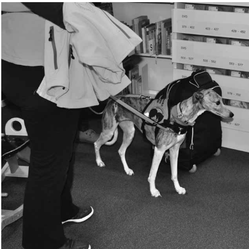
Slika 2: Zala in Ita

Ko je Rik odšel »v pasja nebesa«, je v Občinsko knjižnico na obisk k otrokom in mladostnikom s posebnimi potrebami pogumno zakorakala Ita, ki je izšolana terapevtska psička srednje rasti. Njene lastnosti so prijaznost, umirjenost in potrpežljivost. Z vodnico Zalo sta enkrat en par. Težava nastane le, kadar se nad Jesenicami zberejo črni oblaki in zagrmi. Takrat Ita ne pomaga niti Zalina tolažba. Strahu je preveč. Sicer pa se Ita rada uleže na svojo blazino in posluša pravljico, ki ji jo preberejo otroci in mladostniki s posebnimi potrebami. Glede na to, da med poslušanjem včasih skoraj zaspi, je očitno z branjem zadovoljna. Ita je zelo razigrana in skupaj z otroki in mladostniki s posebnimi potrebami se po pravljici najraje zabavajo z agilitijem. Na spletni strani Komisije za agility je zapisano, da je agility idealna aktivnost za človeka in psa, je veselje do gibanja in tesnega stika s psom. Agility je lahko hkrati rekreacija in zabava, pa tudi tekmovanje in