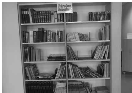
Slika 13: Priročna zbirka

Lažji je tedenski obisk prvošolcev, ki so bili v preteklosti vezani tudi na vremenske razmere. Zaradi namestitve v sosednji stavbi so se morali za obisk knjižnice preobuti in obleči. S tem so izgubili nekaj časa, ki ga lahko zdaj izkoristijo za daljši obisk knjižnice, imajo več časa za izbiro knjig ter samo izposajo.