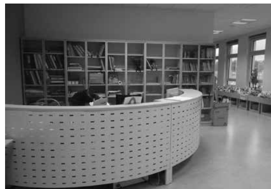
Slika 10: Novi izposojevalni pult

Šele z začetkom rednega dela v novih prostorih se pokažejo pomanjkljivosti. Začetne težave ob vselitvi v novo šolo so se postopno uredile. Med njimi je bilo pretirano hlajenje prostorov, manjkajoča oprema je bila naknadno dostavljena, nameščen je bil tudi pravi izposojevalni pult, ki mu je manjkala še zaščitna ukrivljena