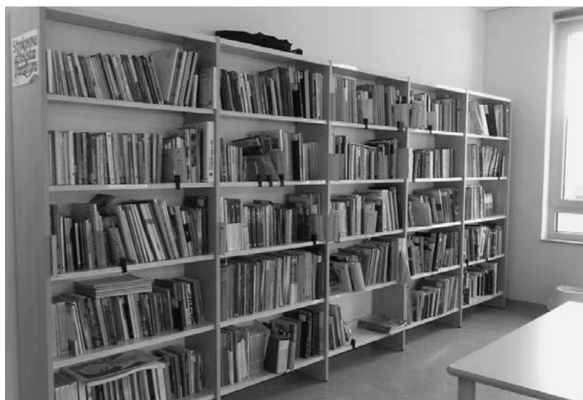
Slika 8: Police za strokovno pedagoško literaturo