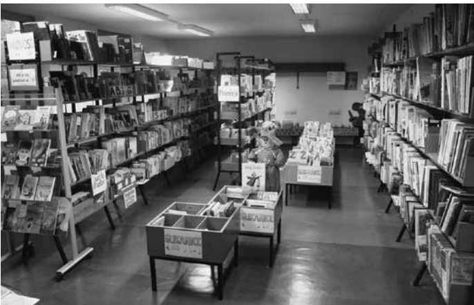
Slika 1: Stara knjižnica

Posebno poglavje predstavlja tudi selitev knjig iz stare šole v novo.