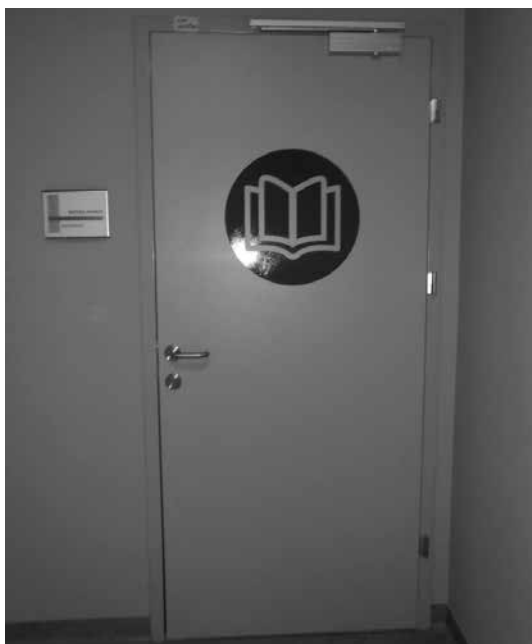
Slika 15: Vhod v knjižnico

učenci lahko prišli v knjižnico le pred pouku ali po njem, v času glavnega odmora, ki se ni ujemal z glavnim odmorom mlajših, pa v knjižnico zaradi motenja delovnega procesa razredne stopnje niso smeli prihajati. Šolsko knjižnico je v novi šoli lahko najti, saj so informativne usmerjevalne table dobro vidne in smiselno postavljene.