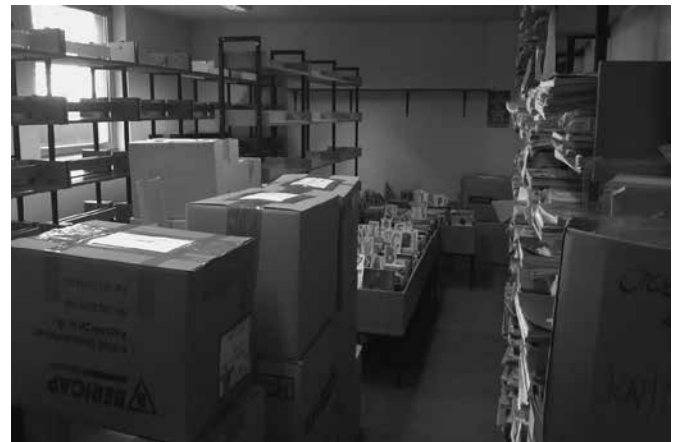
Slika 2: Gradivo iz šolske knjižnice čaka na selitev v nove prostore.