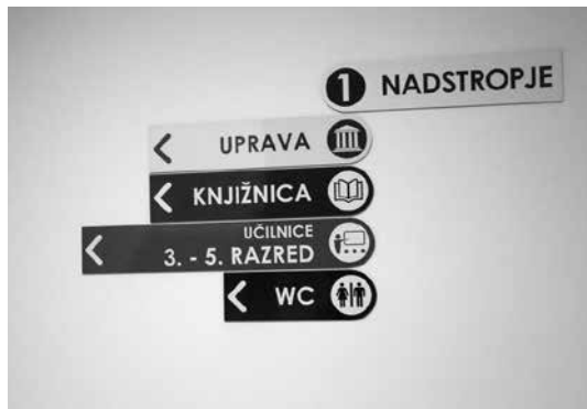
Slika 14: Usmerjevalne table

Učenci so veliko pridobili. Po malico in k športni vzgoji ni treba iti v sosednje stavbe. Vsi učenci imajo enake možnosti za obisk šolske knjižnice, medtem ko so v preteklosti starejši