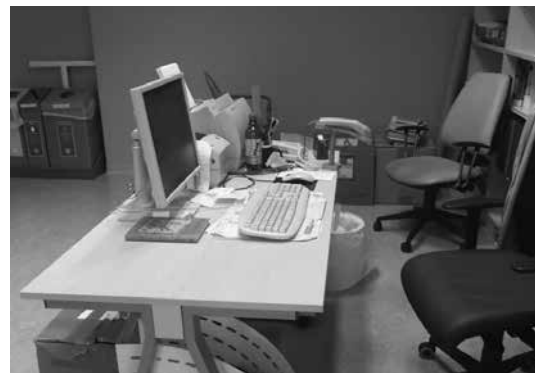
Slika 9: »Izposojevalni pult« v prvem mesecu

pločevina. Edina pomanjkljivost izposojevalnega pulta je v tem, da njegovi načrtovalci niso pomislili, da so osnovnošolski uporabniki knjižnice tudi najmlajši učenci, prvošolci, ki ne vidijo in ne sežejo prek pulta. Prvotno lokacijo pulta smo nekoliko zamaknili, tako da smo lahko k pultu dodali še premični predalnik, ki je na razpolago pri izposoji za najmlajše.