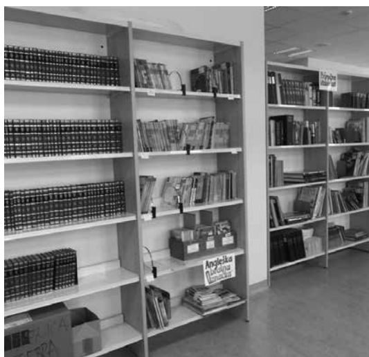
Slika 12: Police za tujejezično bralno značko

Oprema in prostor delujeta na zaposlene in obiskovalce pozitivno, tako da je motivacija za obisk temu primerna.