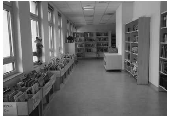
Slika 5: Zabožki s slikanicami za najmlajše bralce

Omenjene smernice navajajo, da morata biti pohištvo in preostala oprema trpežna, funkcionalna, prilagodljiva, enostavna za vzdrževanje in estetska. Priporočila so bila upoštevana, tako da notranja razporeditev in oprema omogočata hkratno potekanje različnih dejav-