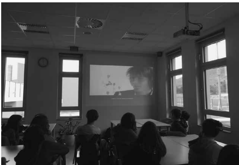
Slika 11: Pouk državljsanske vzgoje in etike v čitalnici

morov (za učence prvega triletja in 4. razreda ter učence drugega in tretjega triletja).