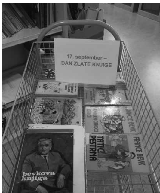
Slika 3: Vsestransko uporaben voziček v šolski knjižnici

Glavna arhitektka je sicer ves čas zagovarjala znane normative Ministrstva za izobraževanje, znanost in šport, a je kljub vsemu moje utemeljene pripombe upoštevala in jih dodala v izvedbeni načrt.