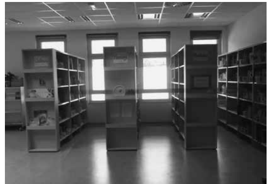
Slika 6: Leposlovje za starostno stopnjo C, P, M

nosti, da so vsi predeli med seboj povezani, ob upoštevanju, da so glasnejši ob vhodu, tihi bolj oddaljeni. (str. 117)