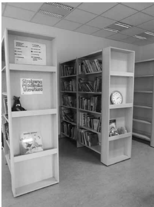
Slika 7: Poljudnoznanstvena literatura

pločevina. Edina pomanjkljivost izposojevalnega pulta je v tem, da njegovi načrtovalci niso pomislili, da so osnovnošolski uporabniki knjižnice tudi najmlajši učenci, prvošolci, ki ne vidijo in ne sežejo prek pulta. Prvotno lokacijo pulta smo nekoliko zamaknili, tako da smo lahko k pultu dodali še premični predalnik, ki je na razpolago pri izposoji za najmlajše.