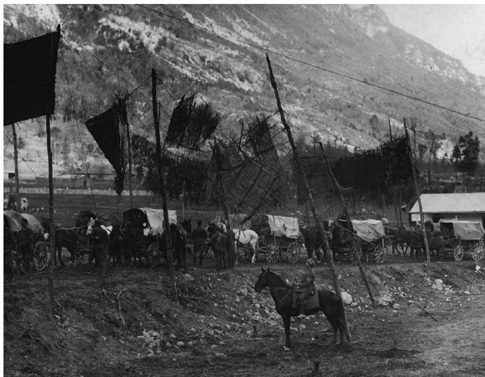
Na cesti iz Kobarida proti Čedadu.