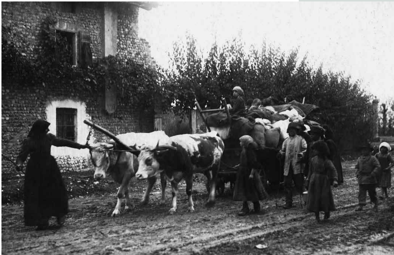
Begunci pri Vidmu na begu pred vojno.