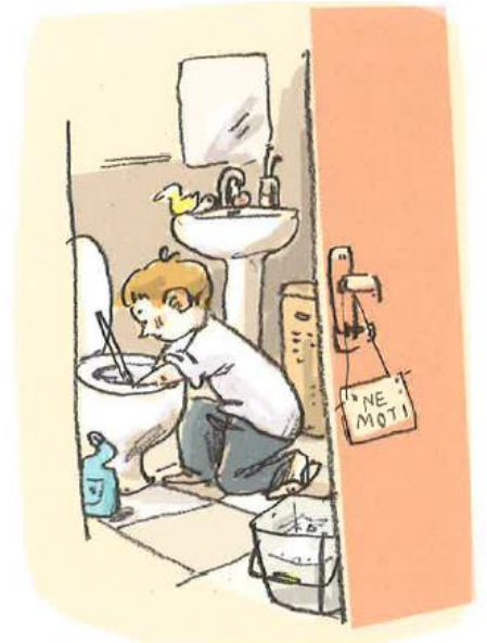
Vir: Nataša Konc Lorenzutti, Ana Zavadlav, Kakšno drevo zraste iz Mačka, Založba Miš, 2023