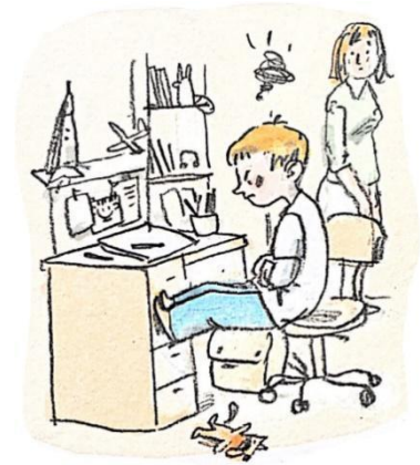
Vir: Nataša Konc Lorenzutti, Ana Zavadlav, Kakšno drevo zraste iz Mačka, Založba Miš, 2023

Katero dogajanje prikazuje ilustracija?, Kakšno razpoloženje izraža?, Kakšne so lahko posledice?, Se je tudi tebi že zgodilo kaj podobnega?, Opiši v povedih in pazi na pravilnost zapisa.