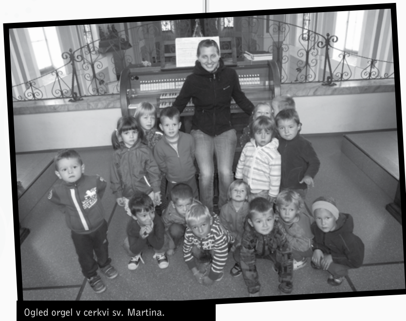
Ogled orgel v cerkvi sv. Martina.