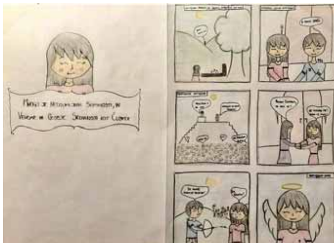
► Ilustracije: Kaja Gerdina

Srednješolski pouk bi za uravnotežen razvoj mladih moral temeljiti na pogostejši dostopnosti umetniških izkušenj pri pouku. Premalo je, če šola zunaj dopoldanskih ur ponuja obisk gledaliških predstav, muzejev in galerij. Nujno bi bilo treba po vzoru SKUM-a pripeljati umetnost in umetnike k pouku in tako pripomoči k boljšemu sprejemanju kulture.