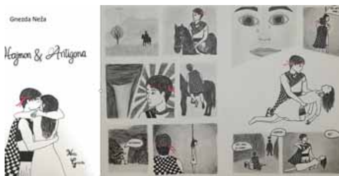
► Ilustracije: Neža Gnezda