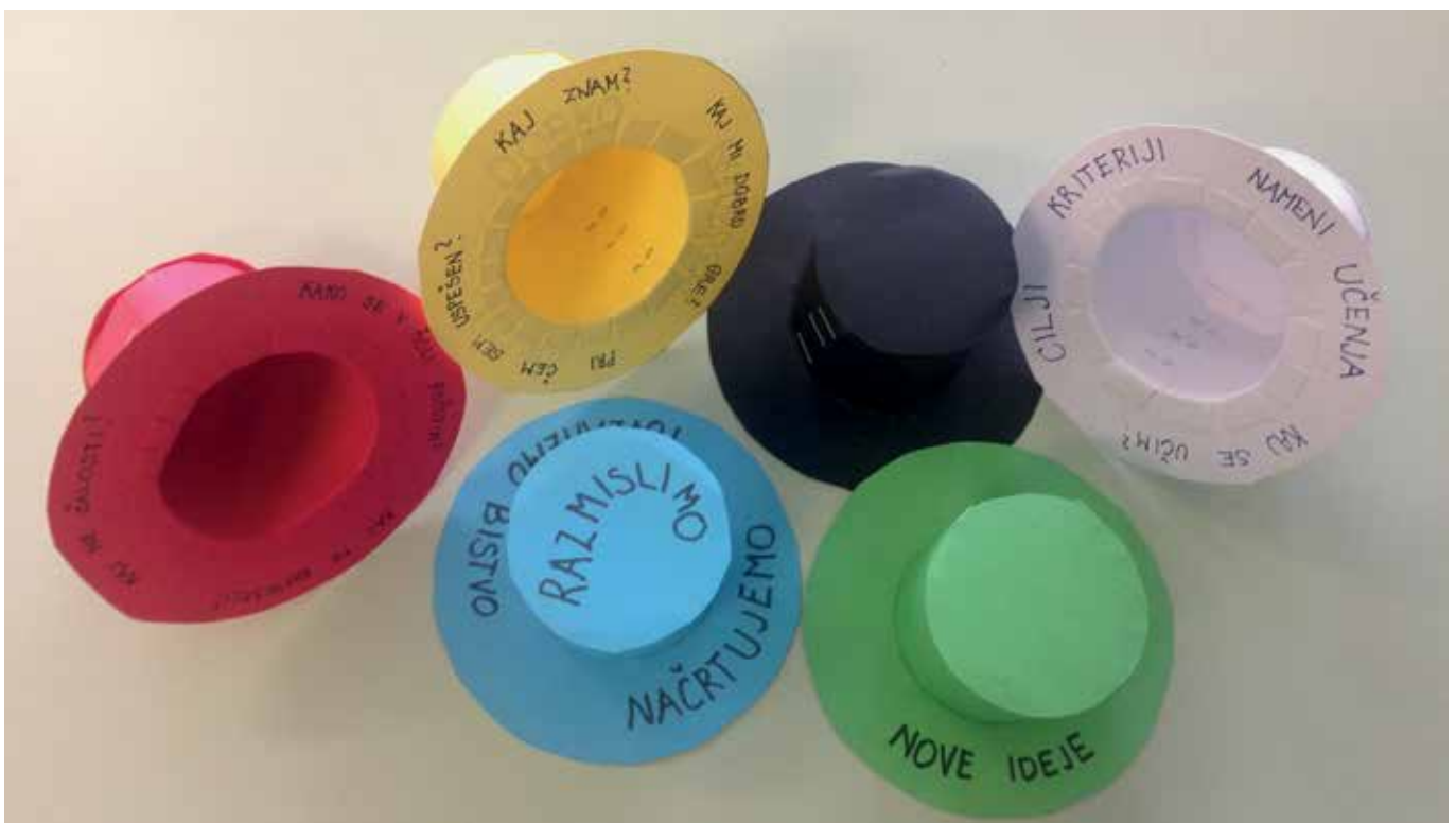
► SLIKA 3: 6 klobukov razmišljanja

Glede na pozitivne izkušnje otrok iz lanskega šolskega leta sem moje letošnje drugošolce povprašala, kateri pripomoček, ki ga uporabljamo za razmišljanje pri pouku, bi jim najbolj pomagal pri razmišljanju o tem, kaj bi želeli staršem povedati na govorilni uri. Po nekaj pogovorih na to temo smo se skupaj odločili, da je to naših 6 klobukov različne načine. Na govorilni uri so pod modrim klobukom načrtovali svojo govorilno uro, pod belim klobukom so govorili o tem, kaj se v šoli učijo in kako vedo, da so uspešni (nameni učenja in kriteriji). Pod rumenim klobukom so govorili o svojih uspehih, pod črnim o težavah in skrbih. Pod rdečim klobukom so govorili o svojem počutju v šoli, kaj jih veseli, česa jih je strah, pod zelenim klobukom so dajali ideje o