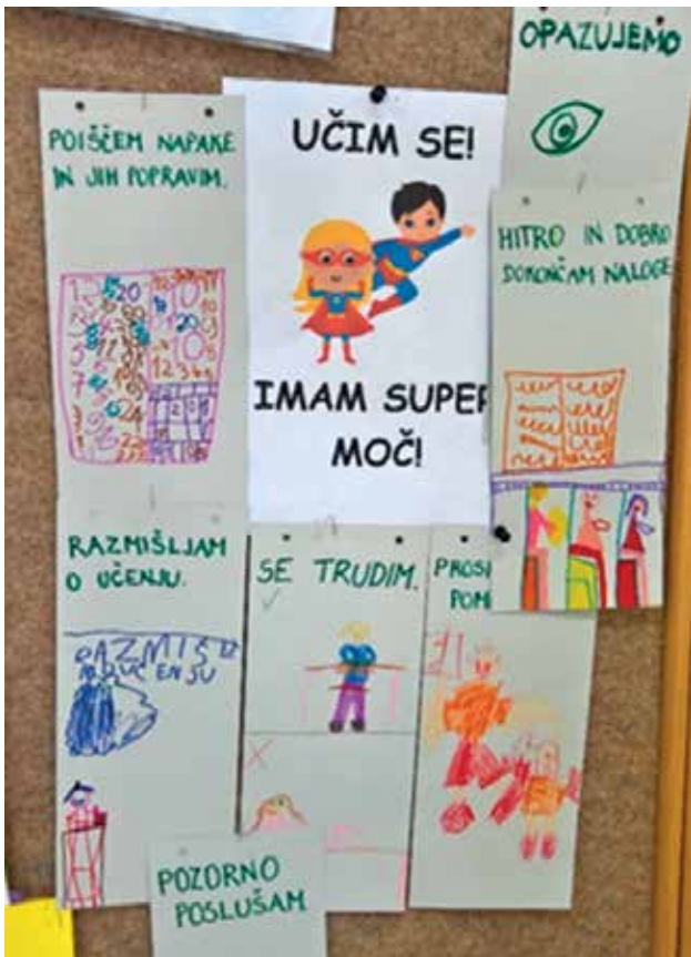
► SLIKA 4: Orodje Učim se – imam supermoč!

Starše sem skupaj z učenci, takratnimi tretješolci, povabila na roditeljski sestanek. Uradni del sestanka z vsemi »resnimi« točkami dnevnega reda smo izvedli v razredu, kasneje pa smo se z namenom povezovanja in sodelovanja v šolski telovadnici igrali različne štafetne igre. Ta del sestanka so v celoti načrtovali, pripravili in izvedli učenci. Ob koncu sestanka se je vsak roditelj s pomočjo iztočnic v oblakih pogovarjal s svojim otrokom. Iztočnice so bile: Razveselilo me je ..., Presenetilo me je ..., Ponosen sem na tebe, ker ..., Današnje popoldne s teboj je bilo ... Ta izkušnja je bila za vse navzoče izjemno pozitivna, zato sem v lanskem šolskem letu s prvošolci in njihovimi starši v šolski telovadnici izvedla celoten roditeljski sestanek. »Resni« del sestanka smo imeli kar na švedskih klopih, ki smo jih postavili v obliki trikotnika. Namen igrivega dela roditeljskega sestanka pa je bil, staršem predstaviti orodja moči, ki nam pomagajo pri delu v razredu. Igrali smo se različne gibalne in socialne igre, pri katerih so morali med seboj sodelovati starši posebej in otroci posebej, starši z vsemi otroki, roditelj s svojim otrokom. Ob koncu so se s pomočjo iztočnic za pogovor v oblakih pogovarjali s svojim otrokom.