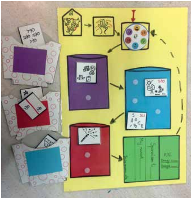
► SLIKA 2: Pripomoček za govorilno uro v 1. razredu

Za pogumen korak smo se odločili v 1. razredu in starše skupaj z njihovim otrokom povabili na govorilno uro že novembra. Skupaj z učenci smo oblikovali pripomoček, ob katerem je učenec sposoben samostojno voditi govorilno uro. Postopoma smo se pripravljali na to govorilno uro v razredu in s skupnim oblikovanjem piktogramov dosegli samostojnost govora. Učenec prek kroga počutja na govorilni uri pove, kako se počuti. Po začetnem pozdravu in razlagi povezanosti, o počutju povpraša še učiteljico in svoje starše. Sledi pripovedovanje o tem, kaj ima v šoli rad, kaj mu je všeč (npr. rad jem ..., med odmori se igram z ..., rad se pogovarjam z ...). Sledi področje šolskih predmetov, kjer si lahko izbere ali izžreba določen piktogram in razloži, kaj se je naučil npr. pri matematiki ... Ker od začetka leta gradimo in upoštevamo šolska in razredna pravila, se dotaknemo tudi področja, kjer spregovori o sebi: kje sem – nad/pod črto; kaj si zase želim ..., in učimo se dajati pohvale samemu sebi. To nekaterim predstavlja težavo in zato moramo to zelo krepiti. Tako postaja učenec suveren vodja svoje govorilne ure.