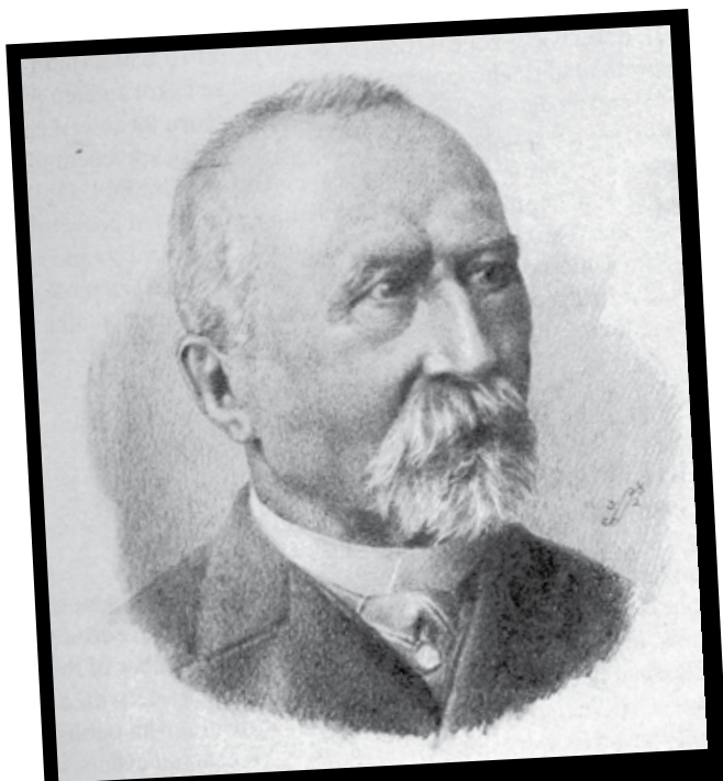
Benjamin Ipavec, portret, lesorez.