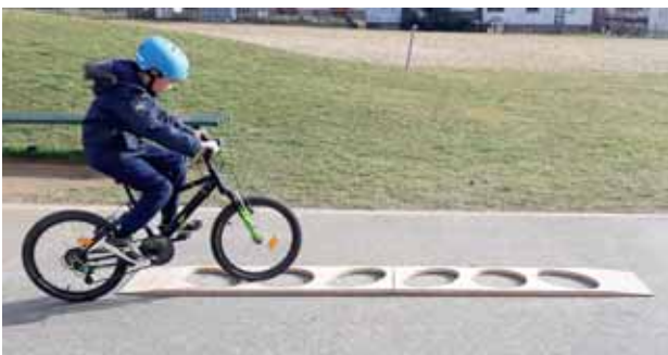
Slika 3: Na poligonu.