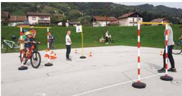
Slika 6: Medvrstniško sodelovanje.

Učenci in mentorica si v dejavnosti razširjenega programa Varna pot vsepovsod zastavljamo veliko izzivov. Kljub temu da aktivnost zaradi virusa Covid-19 občasno poteka tudi na daljavo, upamo, da nam bo zastavljene cilje v tem šolskem letu uspelo doseči. Do sedaj smo pridno koristili svoje možnosti in možnosti kolesarjenja v naši občini ter dokazovali, da je kolesarjenje učencev, ki obiskujejo dejavnost Varna pot vsepovsod , pogosta športna aktivnost, povezana z raziskovanjem, varnostjo, zdravjem, druženjem in predvsem dobrim počutjem ter aktivnim preživljanjem prostega časa.