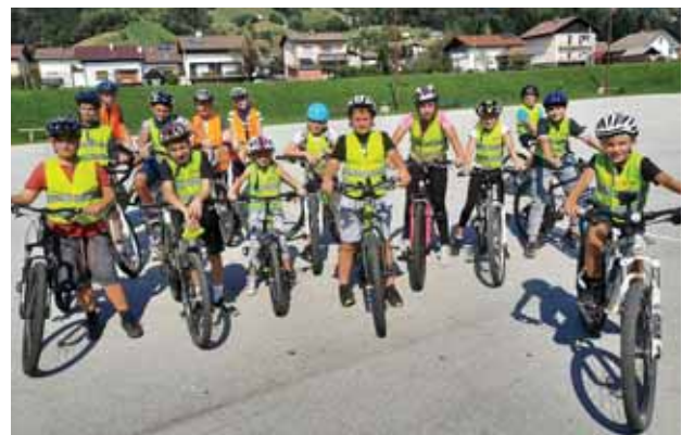
Slika 5: Skupina Varna pot vsepovsod (lasten vir).