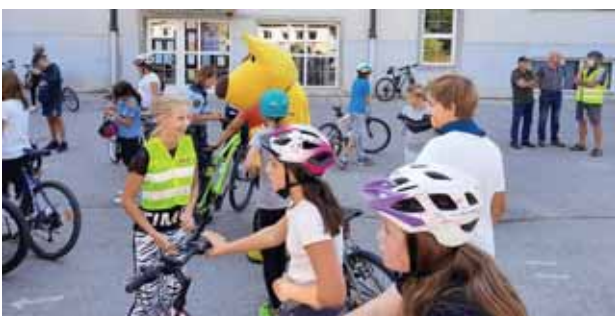
Slika 4: Kolesarski vrvež v tednu mobilnosti.