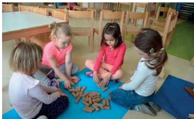
► Gradimo stolp s pomočjo jenge