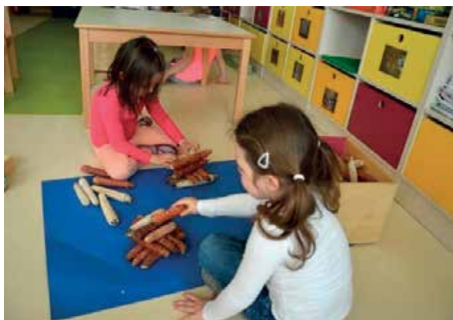
► Gradimo stolp iz koruznih storžev