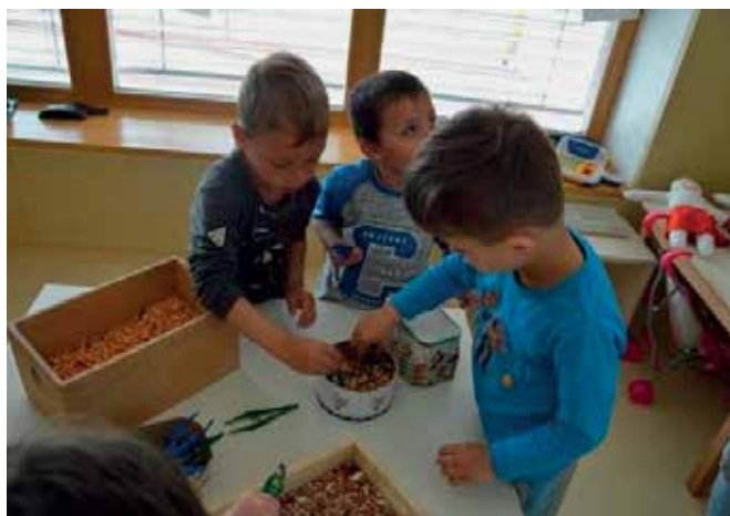
► Prebiranje fižola