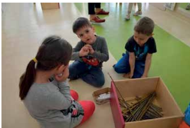
► Matematika tako ali drugače