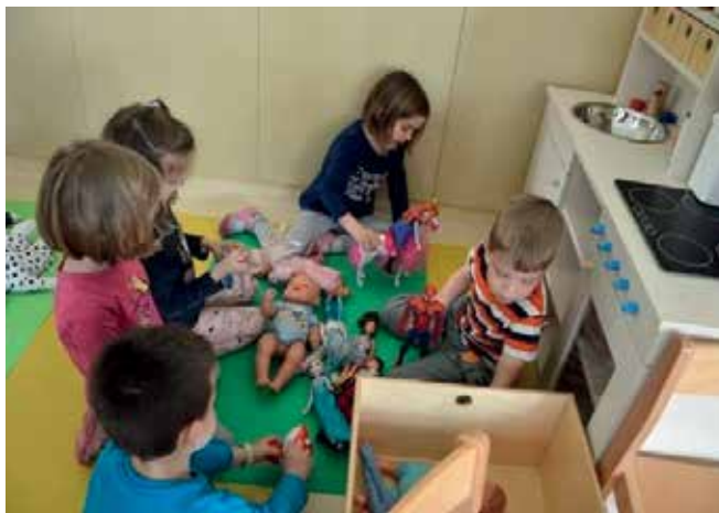
► Igramo se z izbrano igračo

Otroci si želijo nekaj novega, željni so izzivov. Tako tudi začutijo pripadnost skupini in dobijo občutek uspešnosti.