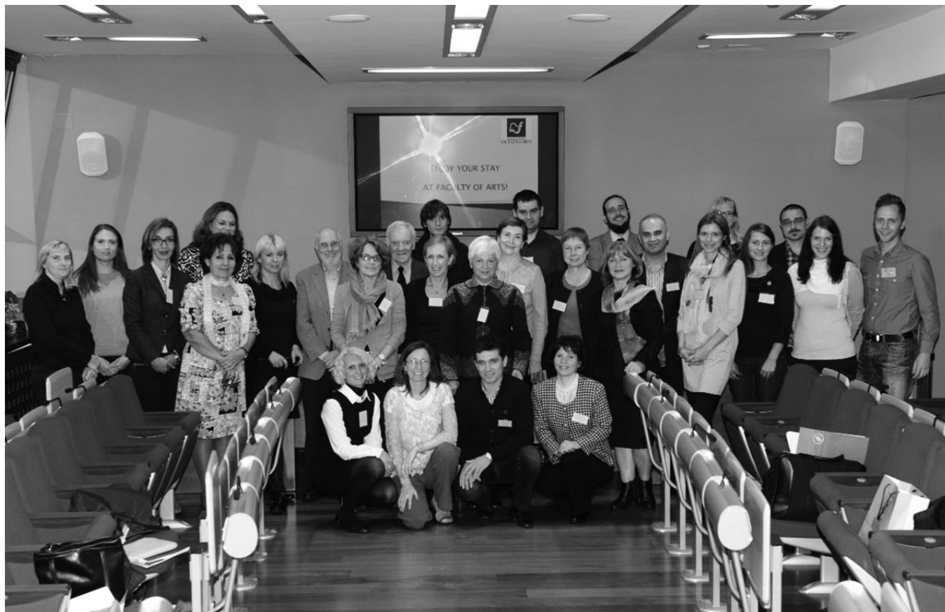
Udeleženci seminarja.

dovine, iščemo vsem skupne vrednote, navade in tradicije, hkrati pa spoštujemo različnost. Vse to spodbuja soodgovornost za skupno dobro, družbeno kohezijo, solidarnost, in kar je v teh viharnih časih ključno – lahko pomaga prinesiti mir v multikulturni svet. Našim učencem pa pouk, obogaten s tako e-knjigo, pomaga: razumeti vsakodnevne politične in družbene procese, razviti kritično mišljenje in odprtost za nove izkušnje in druge kulture, živeti se v perspektivo drugega, uvideti politične in druge oblike manipulacije, najti svoje mesto v multikulturnih družbah ter sami Evropi in svetu, ne nazadnje pa tudi prispevati k spravi, grajenju miru in preprečevanju konfliktov.