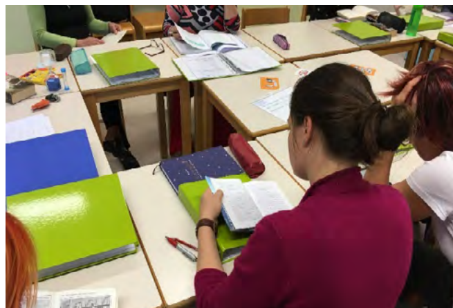
► Ledolomilec – skupno branje

V zadnjem obdobju, ko sem nekoliko ponotranjila tudi formativno spremljanje oziroma vsaj namene učenja, ob začetku srečanj člane vedno seznanim z nameni srečanja in ob zaključku namene skupaj preverimo. Še zdaj ne morem verjeti, kako preprosto je to in kako dober je rezultat.