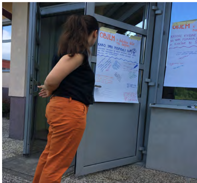
► Povzemanje skupnih ugotovitev članice tima

Drugi način je, da sem vnaprej posredovala gradivo. Na sestanku so člani najprej na plakate vsak zase zapisali odgovore na vprašanja, ki so se vsebinsko nanašala na poslano gradivo in temo sestanka. Ob koncu je eden od članov tima oblikoval povzetek vseh plakatov. Tako sem bila usmerjevalka procesa in odgovornost za uspešnost srečanja je bila porazdeljena na vse člane tima.