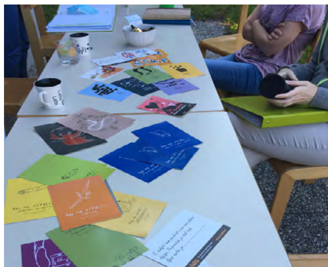
► Sestanek tima na prostem ob karticah »Kaj me osreči«

Kot vodja in članica tima sem spoznala, da je občutek varnosti na prvem mestu, saj v varnem okolju zmoremo razmišljati o svoji poučevalni praksi, jo deliti z drugimi in jo spreminjati. V varnem okolju lahko postanemo učeča se skupnost.