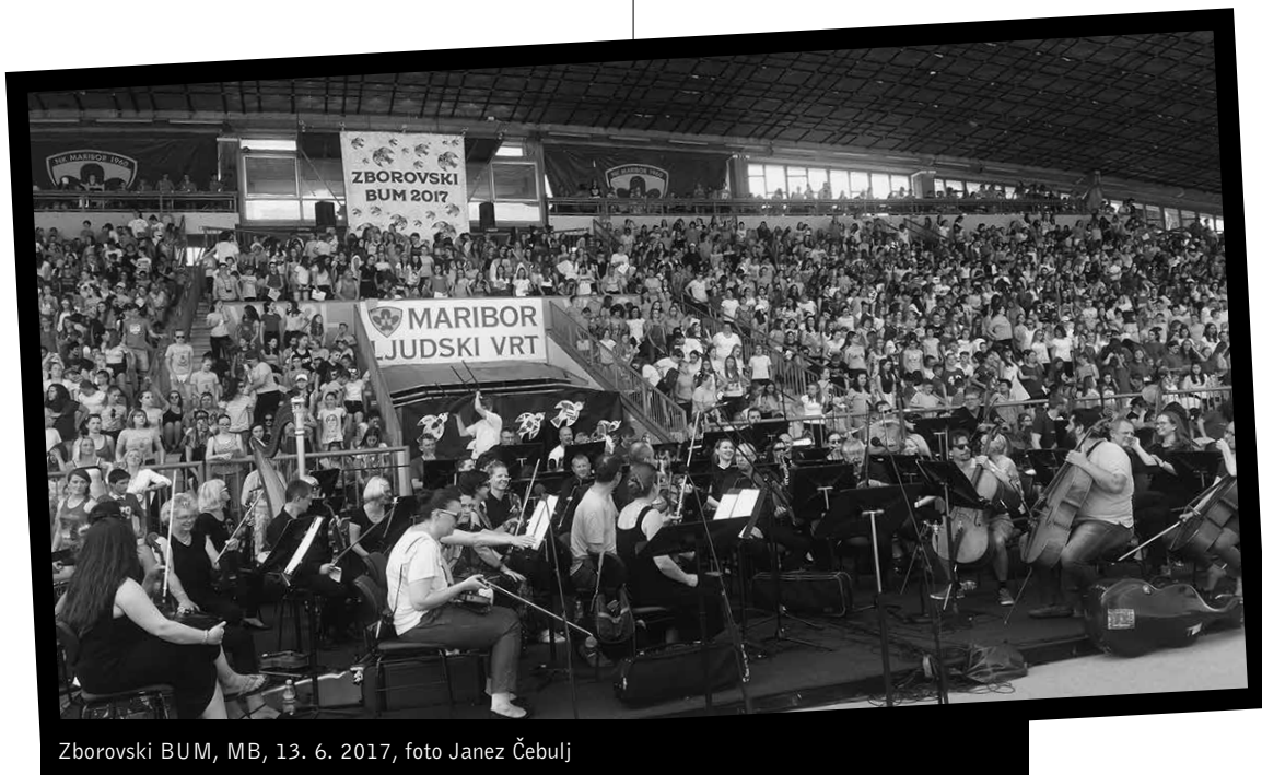
Zborovski BUM, MB, 13. 6. 2017