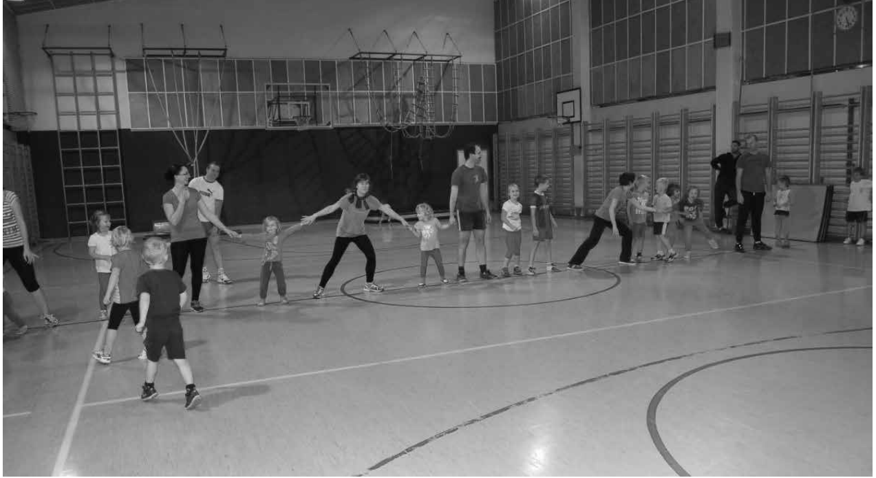
Slika 1: Družinska rekreacija

druženja z otroki. Število družin, ki so vključene v družinsko rekreacijo, narašča, kar nas zelo veseli. Mlade družine se pod mentorstvom športnih pedagogov družijo, rekreirajo in povezujejo. V vseh letih izvajanja dejavnosti se je zamenjalo precej mentorjev oziroma izvajalcev rekreacije. Največkrat so to študentje športne vzgoje, ki pa potem, ko dobijo službe, prenehajo sodelovati. Iščemo jih prek poznanstev in do sedaj smo bile še vedno uspešne ter z njihovo strokovnostjo in zavzetostjo zelo zadovoljne. Plačujemo jih iz našega proračuna.