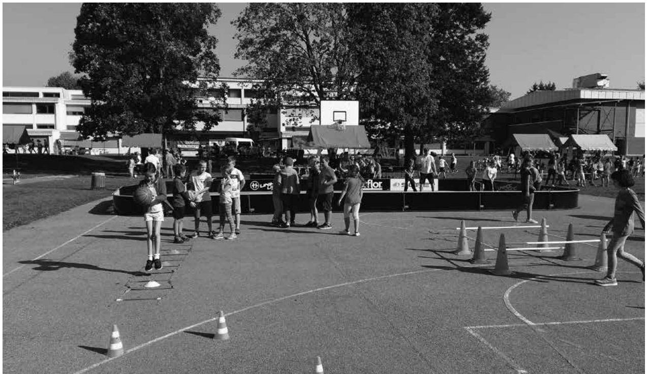
Slika 2: Prireditev Veter v laseh

Zaenkrat smo odločene, da z vsemi rednimi dejavnostmi nadaljujemo, ponovno pa se bomo lotile projekta Oživimo igrišča, ki smo ga že izvajale pred leti. Gre za to, da štiri sobote zapored na enem izmed loških igrišč s prostovoljci izvajamo razne igre na pros-